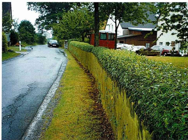
■滿眼的油綠及寬尙的生活空間，讓鄉村與城市有明顯的區隔。

值得一提的是儲藏室，幾乎家家皆有，置放物品無奇不有，清掃器具如吸塵器固不在話下，遮陽傘、桌椅、備用材料、園藝器材、各種工具如砂輪機、電鑽、電鋸、工作台等，叫人眼花撩亂嘆為觀止，可見德國人DIY風氣之盛。這點也令我們眼紅不已，想想台北的家鴿子籠一般，幾曾有這般容量將所有雜物集一室而藏之，遮得許多醜？