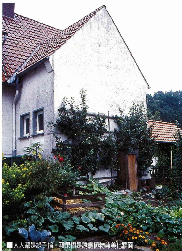
■人人都是綠手指。蘋果樹是誘鳥植物兼美化牆面。

為避免車輛高速直行，且行經村內的車輛也會自然減速減少車禍發生，確保村內居民交通安全，曲折蜿蜒的路形是德國鄉村社區道路規劃的一大特色。社區更新之後的馬路，增加了綠帶設計，並設置人行步道、停車場、休憩座椅，配合住家庭院綠美化及增加地表透水面積等，均是他們秉持景觀、生態及人性使用等多面向的思考，他們認為這樣的設計，除了提供道路使用者更多視野變化的效果外，也能有效控制車行速度；德國鄉村社區曲線道路的設計除了符合生態尺度之外，更顯現一份人性化的自然美。