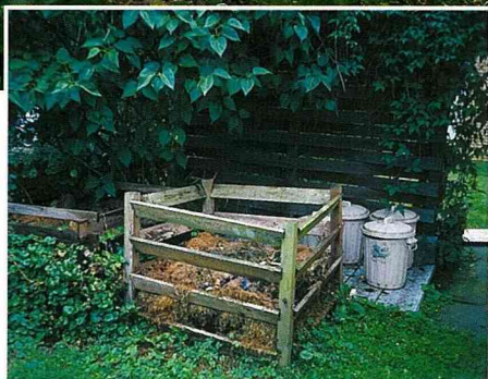
■家庭垃圾分類與堆肥箱。

村的經濟，亦兼顧良好景觀的維持，更強調生態的維護，這點帶給我們這群訪客許多感動。