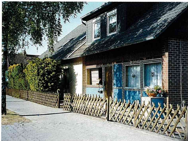
■古樸持重的建築語彙，顯現德國人講求規律的民族性。

以我們家為例，位於 Badisel 休閒區旁邊，5個人享有一幢獨立門院，大約20餘坪，雖面臨街道，但入口處位於巷道，保存了住戶應有的安寧，大片氣密式玻璃窗裝飾著白色蕾絲，主控了與外界的接觸，也隔絕了灰塵及噪音。臥室、起居室、廚房、衛浴及相關傢俱一應俱全，室外庭院綠地、儲藏室、晒衣場、垃圾場，功能完整，比起台北的家只怕更勝一籌。