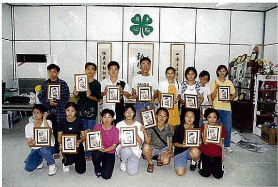
■這是我們紙糊雕作品，不賴吧！