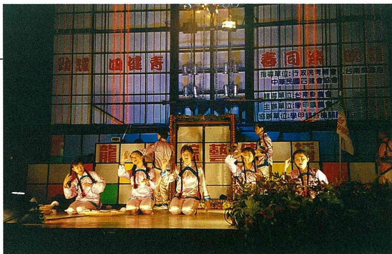
■青春同樂晚會—民族舞蹈表演。

學甲鎮約有10%的青少年是四健會員，農會將原本的倉庫改裝成「四健會館」，這會館讓四健學員隨時可以造訪，隨時可以使用，