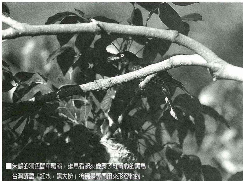
■朱鷓的羽色簡單豔麗，雄鳥看起來像穿了紅背心的黑鳥；台灣諺語「紅水，黑大扮」彷彿是專門用來形容牠的。