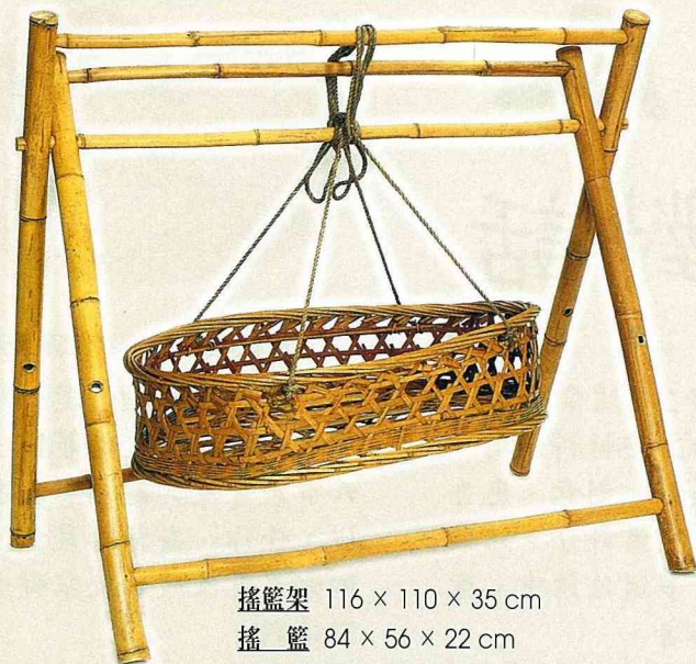
搖籃架 116 × 110 × 35 cm