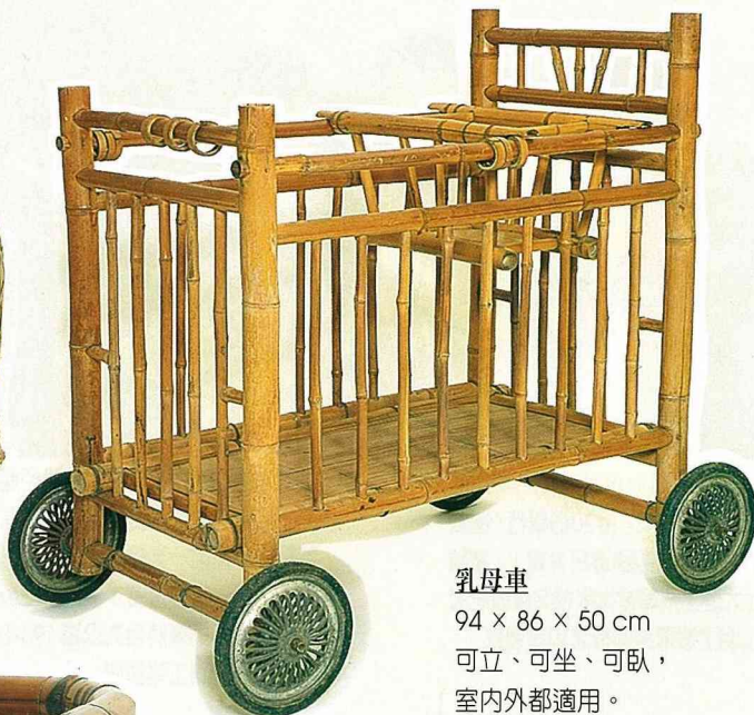
乳母車 94 × 86 × 50 cm 可立、可坐、可臥， 室內外都適用。