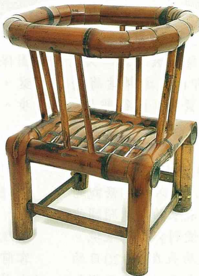
乳椅 35 × 27 × 25 cm 四面可坐，四平八穩， 是 7-8 個月齡幼兒 學坐的良椅。