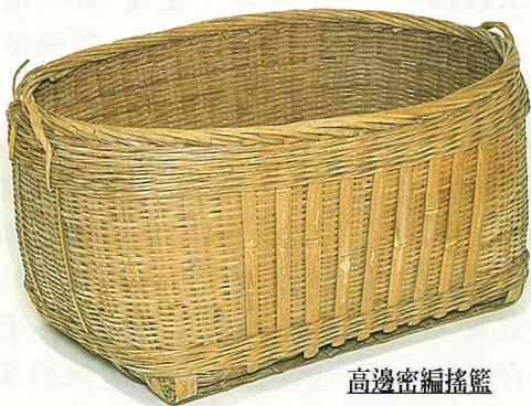
高邊密編搖籃 80 × 54 × 38 cm 這是新竹地區人家所用， 新竹風的威力，嬰兒就能感受到。