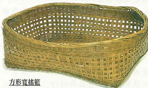
方形寬搖籃 75 × 65 × 24 cm 這個搖籃比一般的要寬， 是給雙胞胎用的吧？