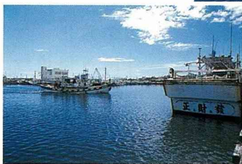
■現代化的蚵仔寮漁港。

「北農南漁」是梓官居民分佈的一大特色，包括蚵寮、赤崁、茄典等地區之居民，多數靠海為生，海是漁民的故鄉，也是漁民生計之所繫；漁民打魚必須要靠漁船，漁船每天都要出海，漁港是漁船的家。在過去新式漁港尚未完成的日子裡，漁民也是靠天吃飯，每天進進出出的漁船，必須停靠在距離岸邊尚有一段距離的沙灘上，