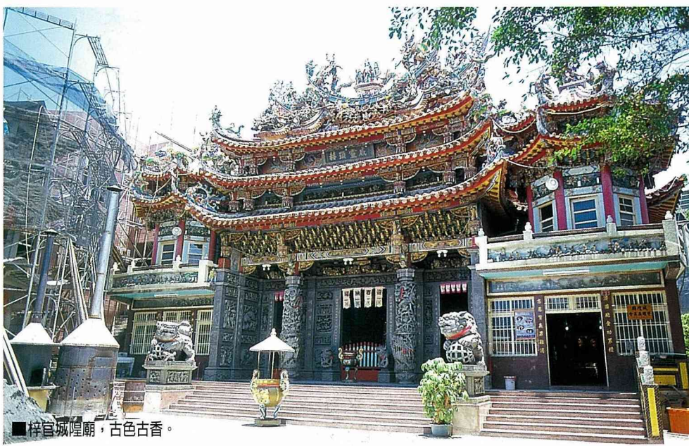
■梓官城隍廟，古色古香。

有所寄託，遂興建廟宇，奉祀池府千歲，以保境祐民，後因梓官蔡姓與淵官李姓民眾，相互發生土地糾紛，鳳山縣衙束手無策，而由台南府派道爺前來平息紛爭，並倡議將原池府千歲廟，改奉城隍爺為主，以池府千歲為副，而獲得民眾的支持，於是發動捐地，並完成建廟迄今。