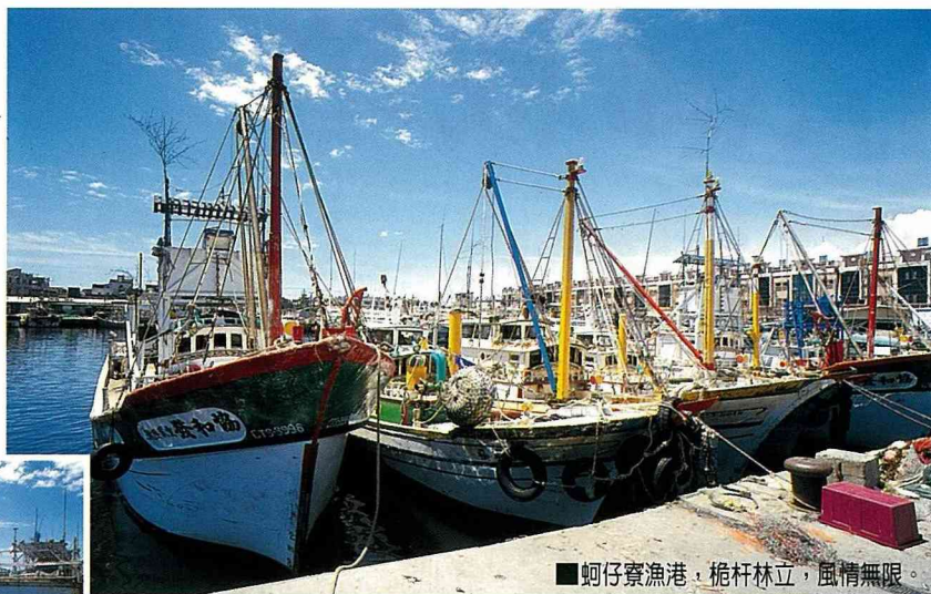
■蚵仔寮漁港，桅杆林立，風情無限。