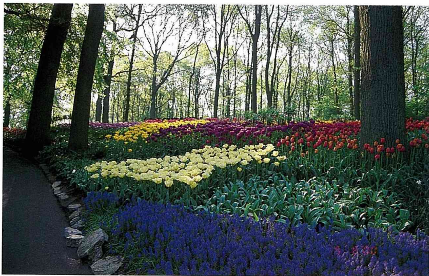
■高聳蓊鬱的林木、繽紛有致的花朵，織就出一幅獨一無二的景色。

到了1840年，公園的範圍首次劃定，面積有32公頃，並由德國的造園家Zochter父子二代，以英國式自然風格的手法來規劃設計，現在在公園內的山毛櫸小徑和池塘都是當時所保留下來的。