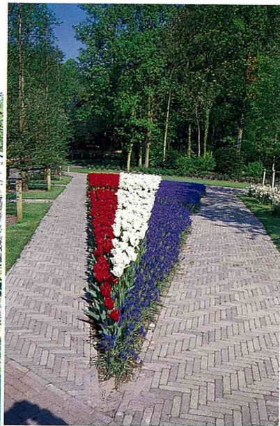
■走在公園中，隨處隨時都有驚艷的感覺！

garden)，這是在去年慶祝球根花園展出滿50週年的同時，為求多元化經營，於是開辦了夏季花卉展，今年的展期是在8月3日到9月17日，參與演出的主角有唐菖蒲、百合水仙、洋桔梗、大理花、球根秋海棠、