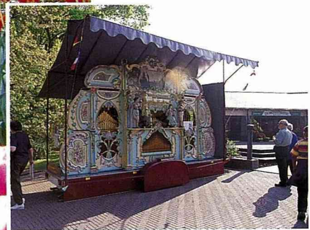
■ 定時演奏的音樂機。