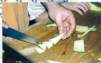
■這是媽媽正在做聖誕樹。

備註：(一) 教導孩子工作與遊戲時注意安全。 (二) 彼此讚美和鼓勵，建立溫馨的人際關係。