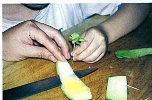
■那也是小孩做的西瓜樹！

德國人喜歡啤酒，一位旅歐回來的好友說初次看見外國人將啤酒、香檳及西瓜略切碎合在一起食用，非常的訝異！就像雞尾酒般連酒帶瓜一並食用。西瓜在德國的價格不便宜，日本人也將啤酒淋在西瓜上食用，也有人醃漬西瓜，同樣的西瓜各地有不一樣的吃法。