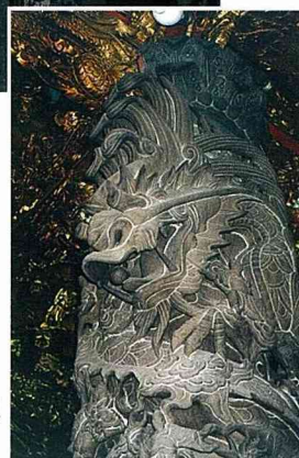
■大甲鎮瀾宮內的龍柱石雕。

旬，大甲鎮就會擠進隨（進）香人潮。進香路線由大甲沿海線經清水、沙鹿、龍井、大肚、彰化、花壇、員林等地。進香團細分為神轎班、轎前吹、哨角隊、三十六執士、繡旗隊等陣頭，皆由信徒自行組成隨同「天上聖母」進香。這項民俗宗教活動，自台灣光復後恢復舉行至今，仍是台灣規模最大，人數最多，範圍最廣的徒步遶境進香團。