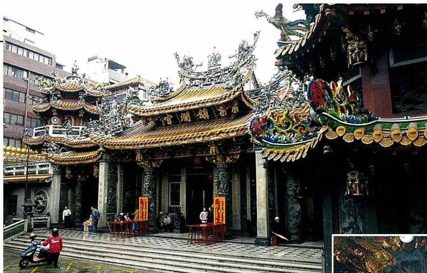
■大甲鎮瀾宮，外觀巍峨。