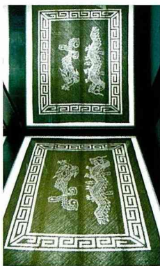
■珍貴的大甲「龍鳳蓆」。