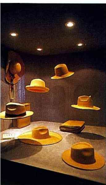
■大甲帽蓆文化館內展示各種大甲帽。