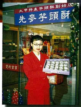
■大甲芋頭酥最佳伴手。

蹟，如三級古蹟節義傳家的林春娘貞節牌坊，香火鼎盛的鎮瀾宮媽祖廟，以及名列中部八景之一的鐵砧山等，是中部地區著名的休閒旅遊勝地。