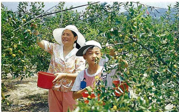
■苗栗區農業改良場輔導棗農釋放草蛉，進行生物防治。