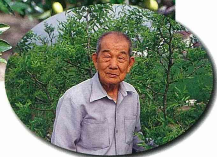
■石墻村最老的紅棗樹，來自陳北開農友的棗園。