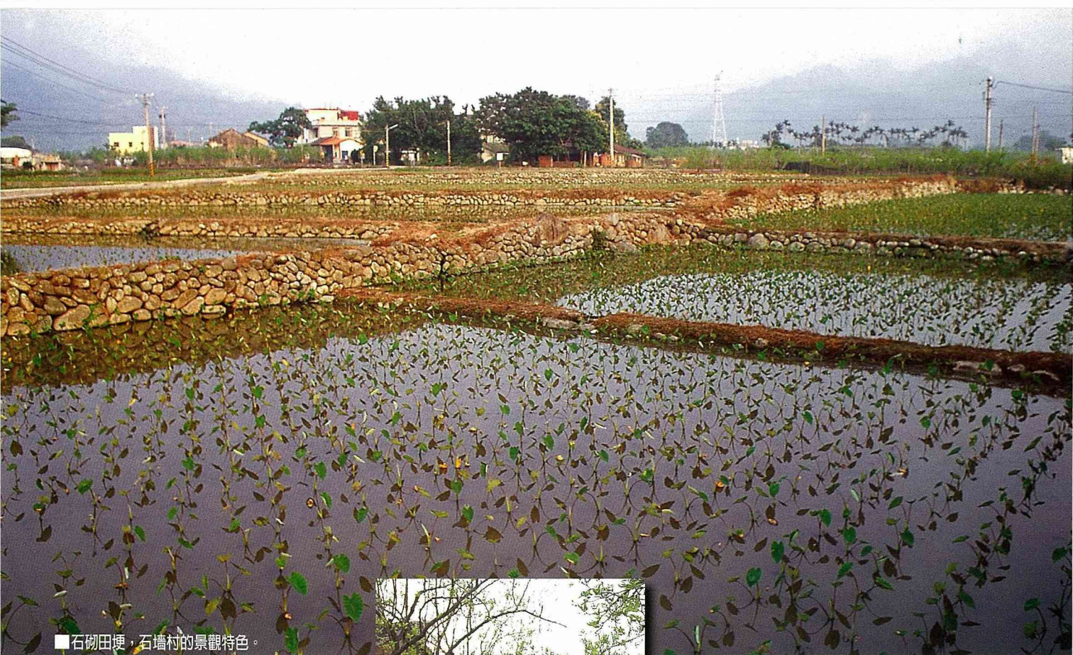
■石砌田埂，石牆村的景觀特色。

果，7月中旬至8月中旬為期一個月的產期，每株產量，依樹齡、剪枝和管理等均有差異，現在公館鄉石圍牆地區每株產量約15-25公斤。近年來政府相關單位及苗栗區農業改良場大力推行觀光採果。農業經營型態，也隨社會脈動在改變。87年起隔周周休2天，帶動觀光休閒和消費人潮。公館鄉農會每年7月中旬，配合7-8月採果期，舉辦開園觀摩說明會，開放觀光採果，從此以後鮮果直銷占90%，乾果10%，公館紅棗因此聲名大噪。