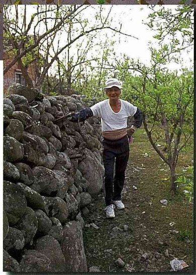
■僅存的石圍牆遺跡。

紅棗每株鮮果產量以20公斤計算，每公頃約種植550株，每公頃生產鮮紅棗果11,000公斤。90%為現場觀光採果，每公斤128元計算，128元X9,900公斤