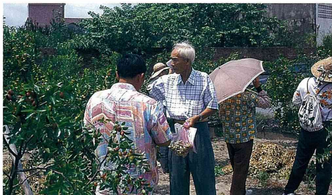
■每年7月中旬至8月中旬，紅棗觀光果園開放，供遊客採摘鮮果。