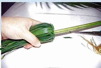
■將葉子板上後再紮一次橡皮筋。