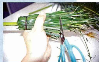
■修去尾梢，略整形後，作品即完成。