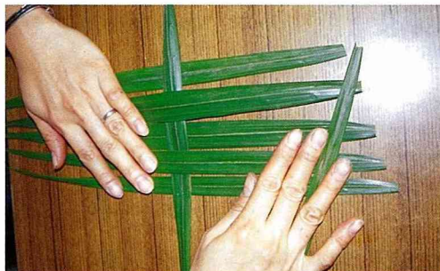
■如圖一上一下編織葉片。

從葉裡行間看孩子，千萬不要把他／她看扁了！我們都希望孩子健康快樂又有成就，不是嗎？看孩子愈好奇的時候，眼睛愈明亮，一件件得意的作品將陸陸續續的登場；你我也不得不拭目以待。