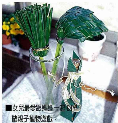
■女兒最愛跟媽媽一起DIY做親子植物遊戲。

南 國的陽光、藍天、碧海、銀波，海灘邊的一把躺椅和幾株椰子樹，風吹樹影搖曳，慢吞吞的散播歡樂浪漫的氣息。每一次佇立在黃椰子樹的身旁，彷彿也能收到大自然裡的青春熱情的脈動。心情特好的人還會聽得到一波一波柔美的海浪聲，從椰子樹傳到黃椰子樹。