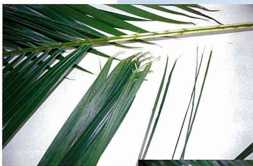
■黃椰子的寬葉子是DIY手編製品的素材。