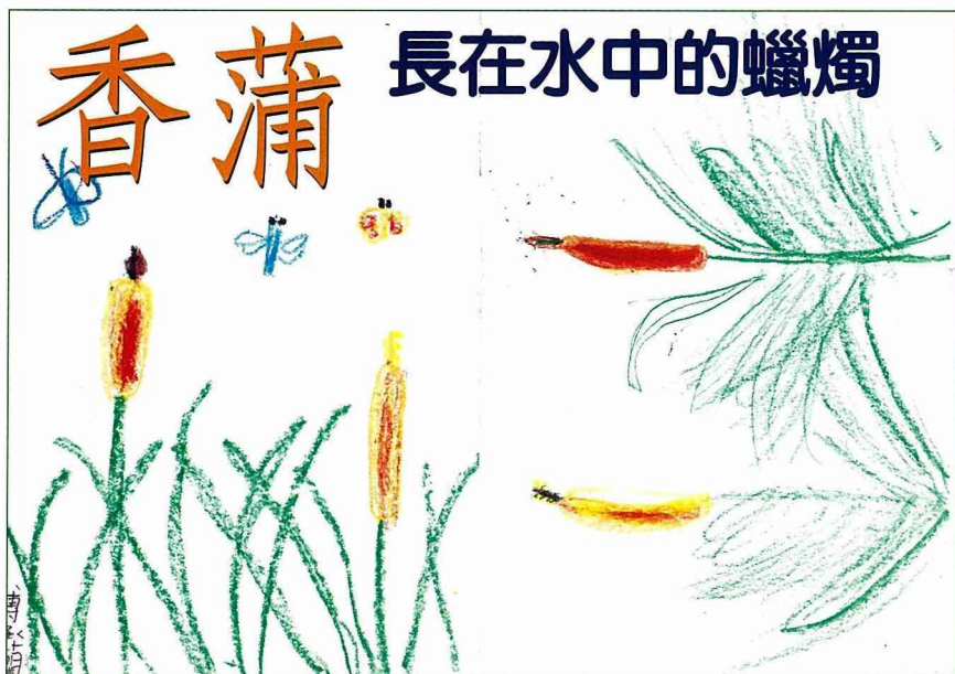
■ 傳承蘭手繪的香蒲。