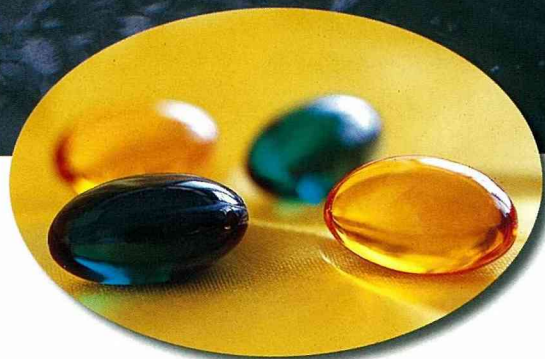
■水療精油球，最時髦的養生新產品。