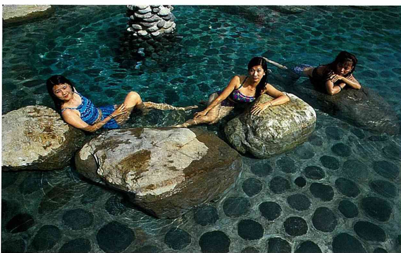
■直接讓身體接觸水的水療法，是提高治癒力的自然療法。