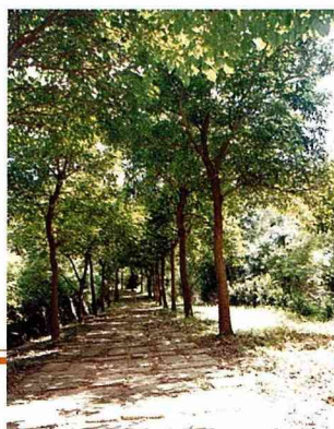
■林蔭步道讓你緊張的生活節奏紓緩下來。