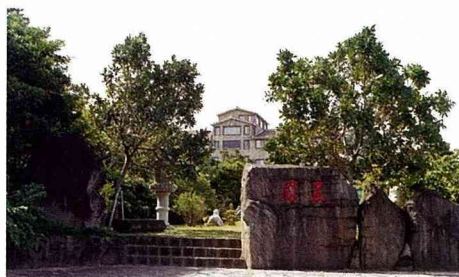
■運用石材營造農場的建築特色。(場景：屏東，恆春休閒農場)