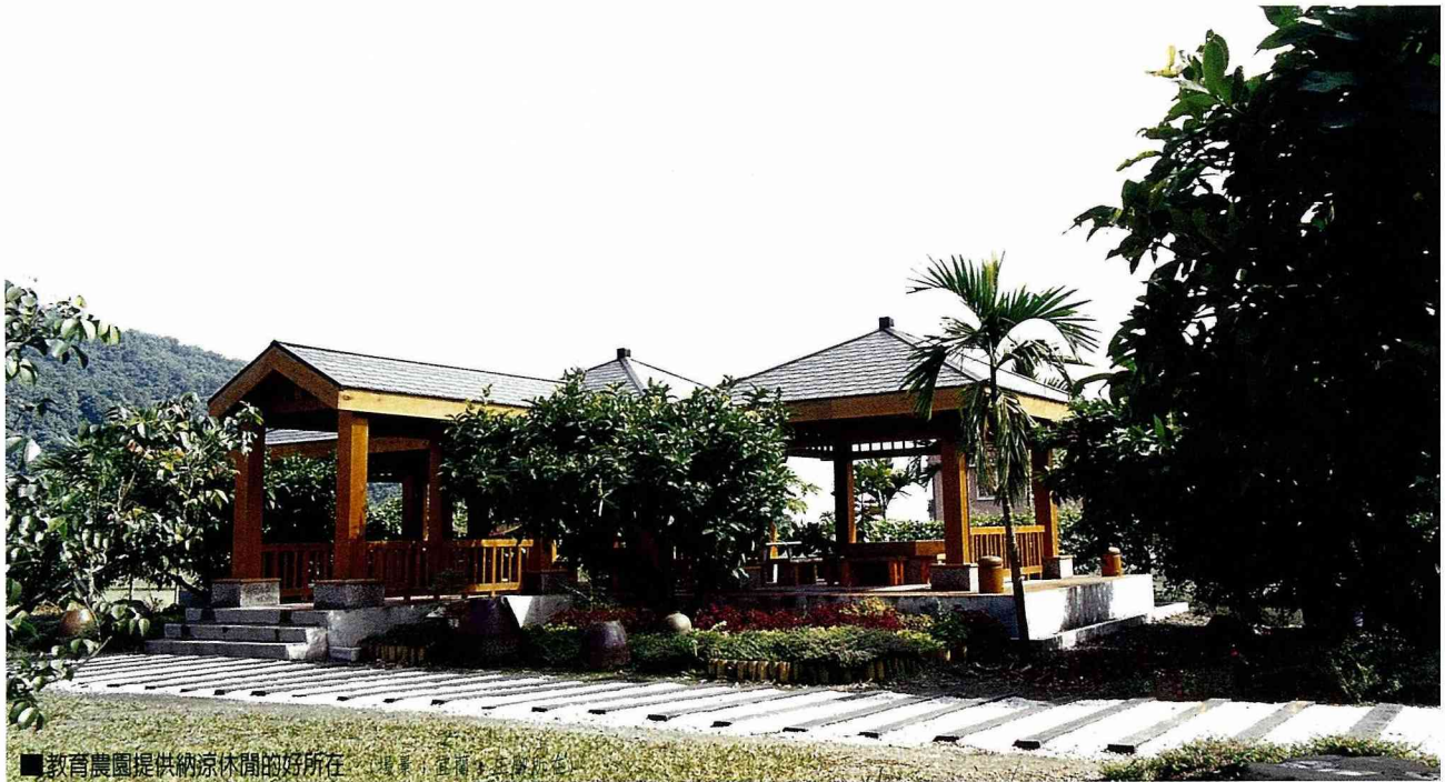
■教育農園提供納涼休閒的好所在

農委會自81年底公布「休閒農業區設置管理辦法」，至89年7月底修訂公布「發展休閒農業輔導管理辦法」為止，歷經七年半時間，期間經過三次法令修改，農民自第一次辦法公布依法申請設置休閒農業區（新申請案七件及前期計畫輔導據點申請案31件），以至89年8月底依現行法令提出申請設置休閒農場（新設立申請案六件及舊農場申請輔導案34件，目前正在農委會同中央相關機關審查中），當中有四分之一係同一農場提出第二次申請，耗費七年多空轉時間，影響台灣休閒農業的發展進程，殊屬可惜。