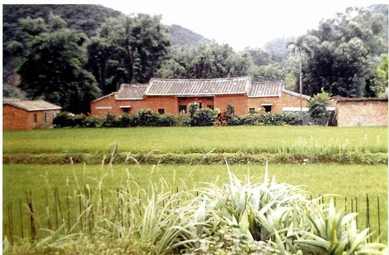
■閩南式建築的農莊，最鄉土的民宿。(場景：南投民宿)

農業措施的推動，需有法令做為各方共同工作的依據，有關休閒農業法令自81年起，經農委會陸續公布與修訂，而休閒農業之業務推行，即隨法令之變遷而調整。包括81年12月30日訂頒「休閒農業區設置管理辦法」、85年12月31日修訂為「休閒農輔導辦法」、88年4月30日再修訂「休閒農業輔導辦法」，及至89年7月31日依照新修正農業發展條例據以修訂為「休閒農業輔導管理辦法」，期間推動情形分述如下：