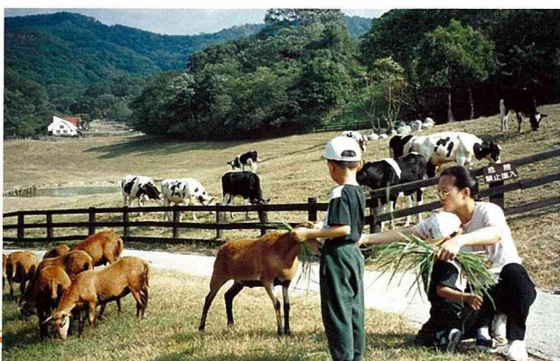
■休閒農場是親子教育的最佳場所。(場景：苗栗，飛牛牧場)

透過休閒農場的E-MAIL做為訂購通訊的依據，利用休閒農場的網路首頁（HOMEPAGE），可以結合多媒體活潑生動的畫面，將農場的特色及行銷活動，成功地傳播給許多潛在的遊客，而透過網路，也可以在休閒農場組成一個會員俱樂部，提供會員折扣及活動特惠的優待，達到服務顧客及商品行銷、資訊交流的多重目標。