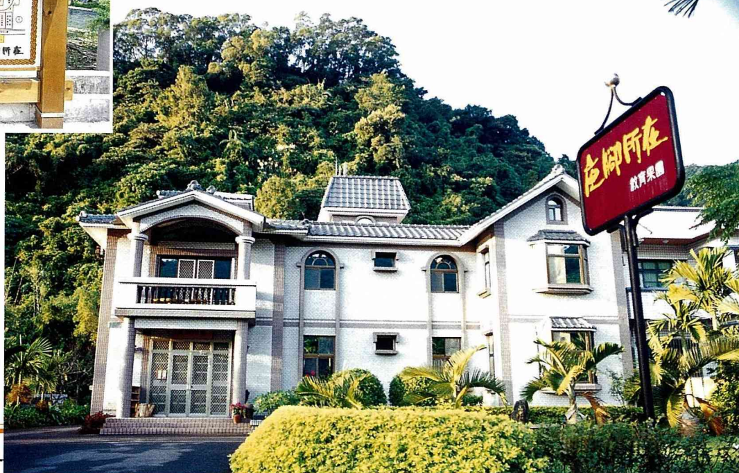
■提供品茗兼民宿的 休閒農莊。