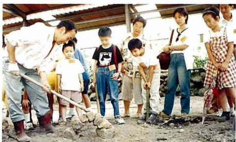
■「燒窯」是老少咸宜的鄉土活動。

發展休閒農業是台灣面對21世紀諸多農業發展策略之一，亦是農業轉型的一個選擇，休閒農業在台灣尚屬起步階段，諸多法規與推行制度有待建立，德國之經驗可供借鏡，惟應發展出一套適合本土之推動模式，目前已存在的課題，需要政府與民間協力即速解決，以建立良好發展基礎。推動休閒農業除政府部門要有充足的經費與人力外，農民在決定投入休閒農業經營時應先作好評估，瞭解自己擁有何種資源和條件以吸引遊客？能提供遊客什麼樣的服務？詳細分析成本和利潤？相關法令規章是否符合？上列各項答案皆屬正數時，即可著手規劃與投入，並尋求政府單位、相關民間團體或學者專家的協助，掌握農業發展的新契機。