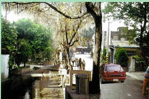
■石墻村主要街道之規劃藍圖。