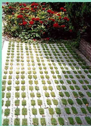
■石墻村民細心維護的植草磚，看不見雜草與落葉。

公館鄉石墻村在社區道路綠化及路旁滲水鋪面建設中，由於居民之參與產生了利弊互見的過程，施工過程中也產生了一些有趣的歷程。例如，居民門前之植草磚停車位由於要進行開挖柏油路面改鋪植草磚，當挖土機進入村中進行一個車位路面開挖工程，柏油塊及泥土級配散落一路時，許多村民產生了對規劃藍圖的懷疑，有人即改變初