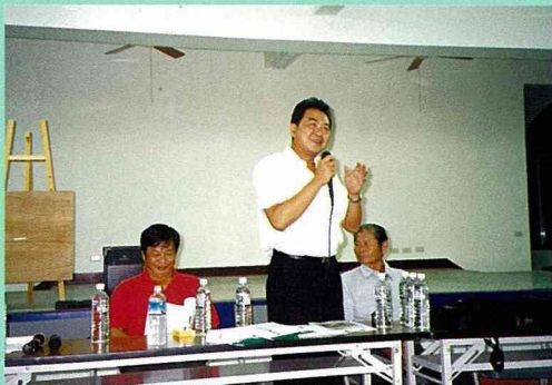
■村長、鄉長等地方領袖，對農村建設的成效，影響深遠。