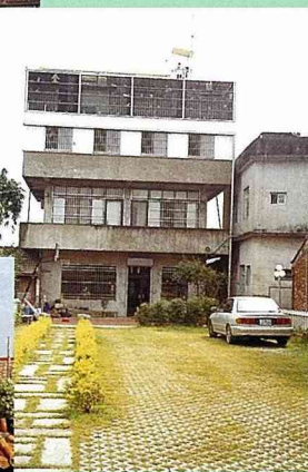
■這一戶居民非常認同滲水鋪面的觀念，把住家庭園完全改為滲水鋪面。