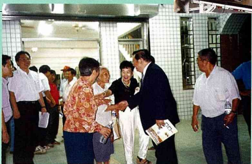
■徐局長全程參與討論會，一一與鄉親致意。

在此要特別一提的是，在石墻村居民參與過程中，「石墻村水資源及景觀生態保育計劃」委託單位水資源局的長官不斷的蒞臨指導，對村民付出的關懷，給予了極大士氣上之鼓舞，因此大夥同心協力，才能共創美好的家園。