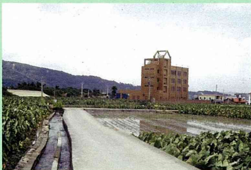
■石墻村農田水路之規劃藍圖。(改善前)