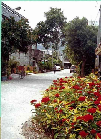
■完工初期的馬路，紅花綠葉讓逐漸灰化的石墻村有了生氣。