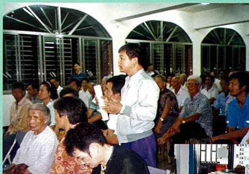
■石墻人當然要關心石墻事。