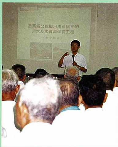
■電腦合成圖的解說，讓村民對未來「看」得見。

夏天熱氣蒸騰的柏油路上飛馳而過的汽車，家家戶戶庭園中的水泥地與磚造的圍牆，雖然顯示了農家生活的經濟富裕，卻讓他們的村莊失去了原有自然與傳統的風貌。