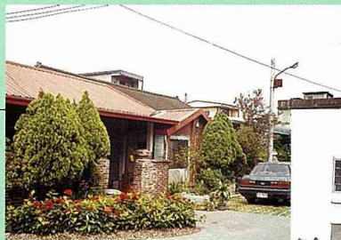
■施工完成的滲水停車位與花園。

居民認同的規劃方案，不僅可將居民的意願具體的表現在實質建設中，也可因其介入，而讓居民產生對公共建設成果之愛惜，這是居民參與很重要的一項原因。今天有許多公共工程建設因為沒有居民參與討論的空間，所以建設完成後，行政單位與使用者之間，往往產生了管理與維護上的爭論，例如路旁