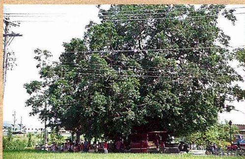
■濃蔭大樹下，通常就是鄉村居民最好的聚會場所。

居 民參與」在農村建設中，已是一個耳熟能詳的名詞了，其意謂著在農村發展規劃與實質建設中，農村居住者皆應積極參與各規劃項目，並提出他們的看法與期望，與規劃者共同打造他們的家園；尤其在執行階段，更需全力配合工程的進行，甚至提供私人的土地做為公共設施興建之用。