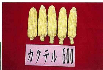
■黃白相間的雙色品種。