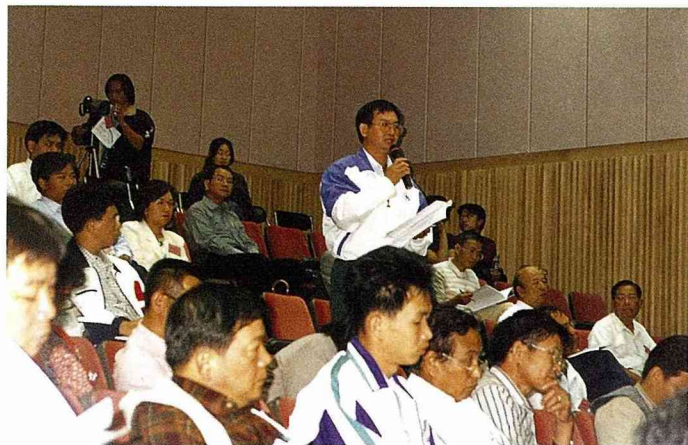
■清水鎮公所代表：我們基層人員其實很無奈，上級交待要做溝渠整治，營建署的標準是U型溝，水保局是生態溝；政府單位缺乏橫向聯繫。

■屏東潮州鎮農會代表：屏東縣80%的山坡地都被劃為水源保護區，30年來違規使用者仍然存在。這是德國不能而我們能的地方！