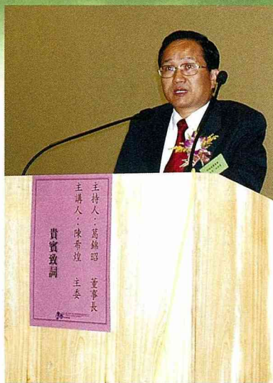
■農委會林國慶副主委：傳統產業的發展，對農村農民有很大的影響，整體農業的提升與全民有關；積極推動農村現代化，可以降低WTO對我農業的衝擊。

農委會林國慶副主委代表陳主委致詞時指出：台灣農村社區發展過去都由上而下，由政府挑選聚落進行更新，硬體方面是有了一些成果；如果能建立一套機制，引發地方力量投入，一定可以加速社區發展由點而線到面去推動現代化。例如嘉義縣水上鄉蝴蝶村，就是在沒有政府經費補助下，當地居民由熱心人士帶動，自動自發改善排水溝等公共設施，種植本土植物進行綠美化，還有人捐地作為社區公園，把鄉里建設成鳥語花香的蝴蝶村。