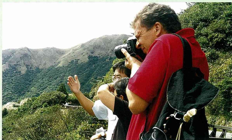
■ 用鏡頭捕捉陽明山國家公園之美。

期前來台灣，背包裡隨時備有相機和筆記，回國之後將寫一篇關於台灣的報導，在報刊上發表。得到歐洲金牌農村獎的鎮長，果然身手不凡，在盧森堡當鎮長，是不支薪的公僕，Gira 先生已經當了 11 年。這樣優秀的公僕，台北人也會選他！