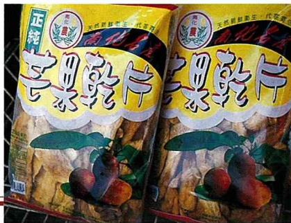
■ 芒果乾片也是台南的特產之一。

芒果入菜，現代人的食物講究精緻美觀，健康養生又可口，有機蔬菜、花卉、水果廣受歡迎，蘋果、芒果、芭樂、蓮霧、哈密瓜皆可入菜，除了營養更增添食