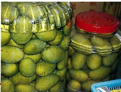
■ 醃青芒果是古傳的鄉土食物，您嚐過嗎？

芒果的別名計有檬果、莽果、樣仔、菴羅果…等。芒果可生食、熟食、加工製造及藥用。芒果是上好的水果，香甜汁蜜，未成熟的土芒果在如小雞蛋般大時，即可採下削皮，切成小塊醃製