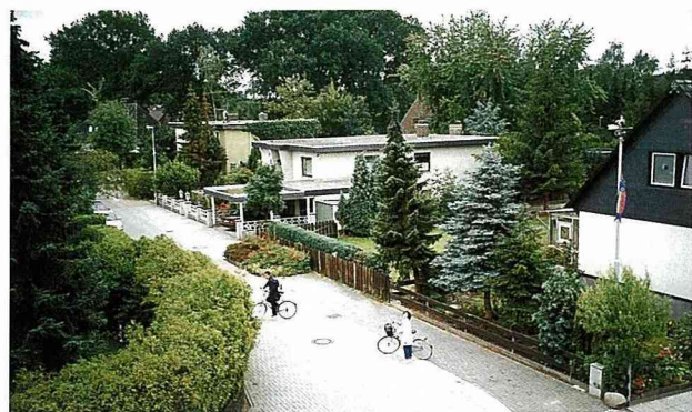
德國農村的美麗，征服了桀驁不馴的台灣青少年。

去年暑假，我有緣能前往德國旅遊；一開始，我聽到要住在鄉下，心中的陰霾又浮現了出來，出國旅行的興奮程度大打折扣，