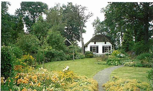
■荷蘭羊角村，小得讓人抓狂的羊腸小徑。

德國的高速公路是不收費的，因為德國的車子性能很好，許多人習慣開快車，為了不影響行車速度，況且這條高速公路橫互歐洲，不少人只是路過德國，卻要準備馬克，很不方便，所以，在德國開車真的很「省錢」！他們對於古蹟的維護更是數一數二、不遺餘力的！例如在老鼠鎮，許多建築都已屬於古蹟，可是為了因應川流不息的觀光客，許多人決定改建，從事商業活動。而政府對於他們的請求給的回覆是：改建可以，一樓可以完全改成現代的建築，但是二、三樓改建後必須維持原樣，包括顏色、任何一塊雕飾或是內部的擺設裝置。聽來真是多麼棒的古蹟保存方法，不但保留了珍貴的文化資產，同時也留住觀光客。如果台灣也能效法，那我也不會每回出門都在猶豫要去六福村或劍湖山？而能夠自然而然的去看看古蹟，看看先民留下的歷史痕跡，多好啊！我期待有朝一日，台灣也能有一個像老鼠鎮保存得那麼完整又吸引人的古蹟。