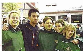
鑲槍節農村遊行活動中，觀映的台灣少年巧遇熱情的德國少女。

當我抵達我們下榻的「民宿」後，又發生了我當初認為最不可能的事：我們所居住的環境，真的不比五星級大飯店遜色；人性化的科學設計、乾淨整齊而且雅致的室內佈置，還有寬廣的活動空間和一個舒服安適的休息場所；圍繞在這房子周圍的彷彿圖畫中才會出現的美景；而這一切就是所謂的「休閒農村」嗎？回想台灣農村的居住環境跟生活品質，看來還有一大段的進步空間囉！