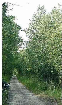
■史坦戶德的森林腳踏車道。

有一天，我們在德國的超級市場裡買了兩顆桃子，一口咬下去，既不甜也不多汁，完全沒有口感可言，充其量只不過是在嚼纖維而已，這讓我想起了台灣梨山的水蜜桃，真的只能用「香甜多汁」來形容，為何政府不統一收購後一起出口呢？反觀荷蘭的農業技術遠近馳名的，以科技創造農業奇蹟！荷蘭政府事先調查鬱金香在哪一季節的需求量最高，再利用燈光來控制鬱金香的成長，等到最高的那個季節，再全部一起出清，獲取