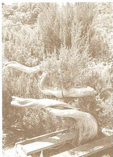
■ 庭院中滿是「大自然的縮影」。

* 盆栽必須經過一段漫長的時間培養，小品至少3至5年，中品也要8、9年，一般較精緻的需要10至20年以上，因此業者必須有耐心，精益求精，萬一基礎沒做正確，重來又花幾十年，所以做法的基本原則是非常重要的一環。