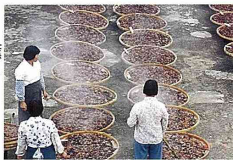
■經九蒸九晒、九蔭露水，使藥材成分充分發揮。

黑沈沈的一鍋湯，用了四十五種藥材，包括何首烏、淫羊藿、銀杏、人蔘、黑麻豆等，燉煉過程極為繁瑣，首先野生藥材需洗淨後進行篩選，破損者一律去除，接著去皮，再將藥材一起經過九蒸九曬、九蔭露水，連續九天，最後以純米酒燉煉。