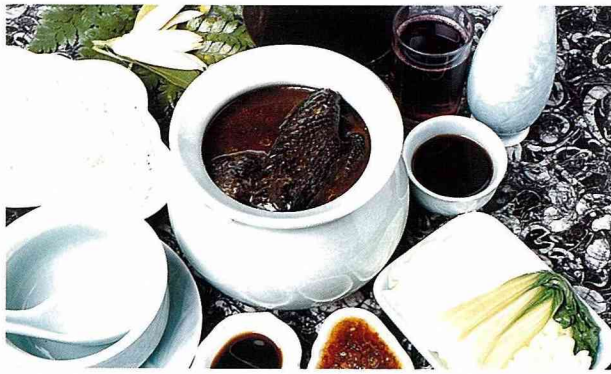
■為方便上班族，也有單人份的套餐供應。