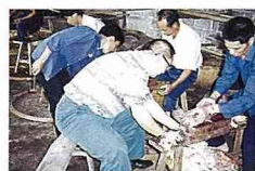
■藥材需先以竹刀去皮。