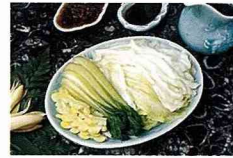
■麵線與汆燙青菜，都是配合食養理念而設計。

整個處理過程中，所有藥材都不能落地，器具也一律使用手工製成的竹或木製品，包括去皮也必須使用竹刀，避免破壞藥材成份，蒸煮所需的燃材也取自雲南當地所產的杉木、松木，以便與藥材氣息、能量相通相合，甚至藥材放入鍋中的時間、順序及火候控制都必須十分精準，以確保功效與風味。