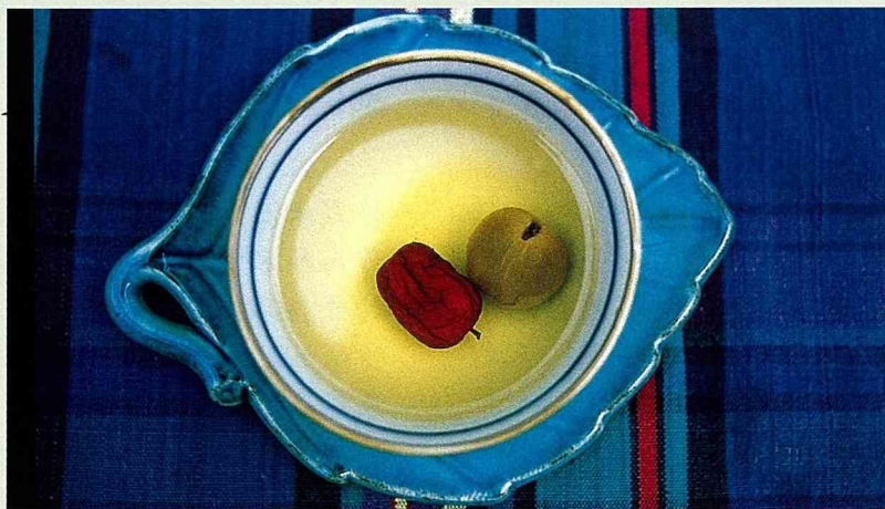
■桂圓福茶香氣四溢。

紅棗不要煮太久，水滾後即可取出紅棗或煮過的桂圓，只要不煮太久兩者皆可留下來享用，尤其是當小朋友最愛的零食。你不妨試一試。