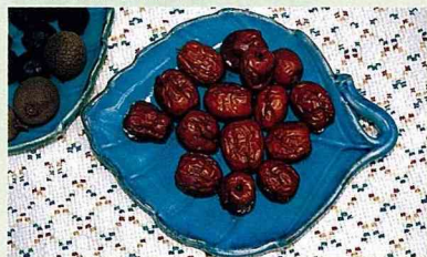
■紅棗的香與甜是另一種風味。