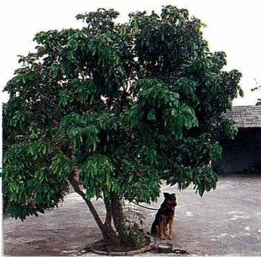
■農家庭院裡的桂圓樹。

桂圓、龍目、圓眼皆是龍眼的別名，龍眼屬無患子科常綠喬木，高可達一、二丈，似荔枝而枝葉微小，春末夏初開細小白花，龍眼的外果皮為青黃色或黃褐色，果肉層較薄，相形之下果核顯得大一些。