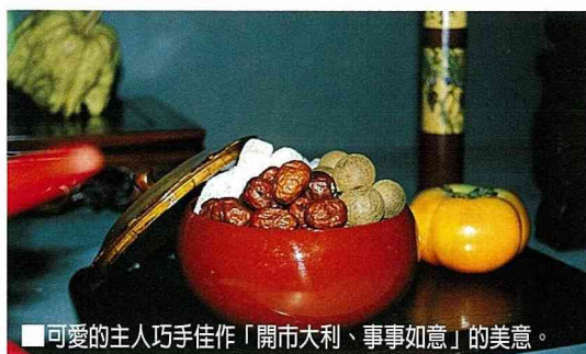
可愛的主人巧手佳作「開市大利、事事如意」的美意。