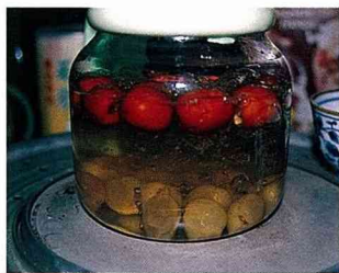
■煮桂圓福茶，可加糖或久煮，隨個人的喜好。

此外還有一種水果紅毛丹，剝開之後果肉神似荔枝，不過風味口感全然不同，原來水果也有個性，在特殊機緣之下，泰國水果在台灣遇見了菲律賓水果。