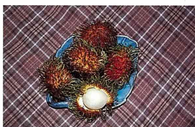
紅毛丹也是進口水果。