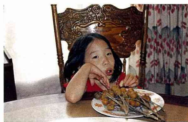
■我愛桂圓，很好吃喲！

最近在市場水果攤上看到一種水果，一眼望去很像桂圓又像枇杷，圓滾滾的一粒，剝去外殼聞起來像柑子或葡萄柚的香味，嚐起來有點香甜有點酸，像是柚子，果肉白色，一扇一扇的集成一球，有種子，有些則無。問老闆說這水果叫什麼名字，他不清楚是否正確，只管叫它是菲律賓枇杷，我忽