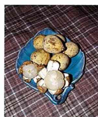
菲律賓枇杷的外形，像桂圓又像枇杷。