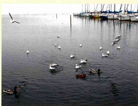
■野鳥、船隻、湖畔之美景。

其實，從史坦戶德來看，建造一個好的居住環境就如同在經營一個家庭，必需大家共同努力，使他能夠在經歷各種變化下得以永續經營發展下去，讓每戶家園皆是“豪”（好）宅，而非“毫”宅。