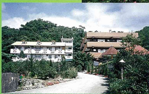
■農場遊客服務中心。