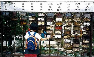
■神農館展示藥用植物。