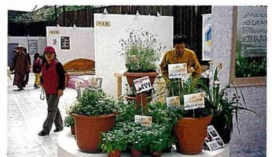
■芳菲館展示香草植物。