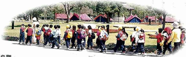
■學生來參觀，進行戶外教學。