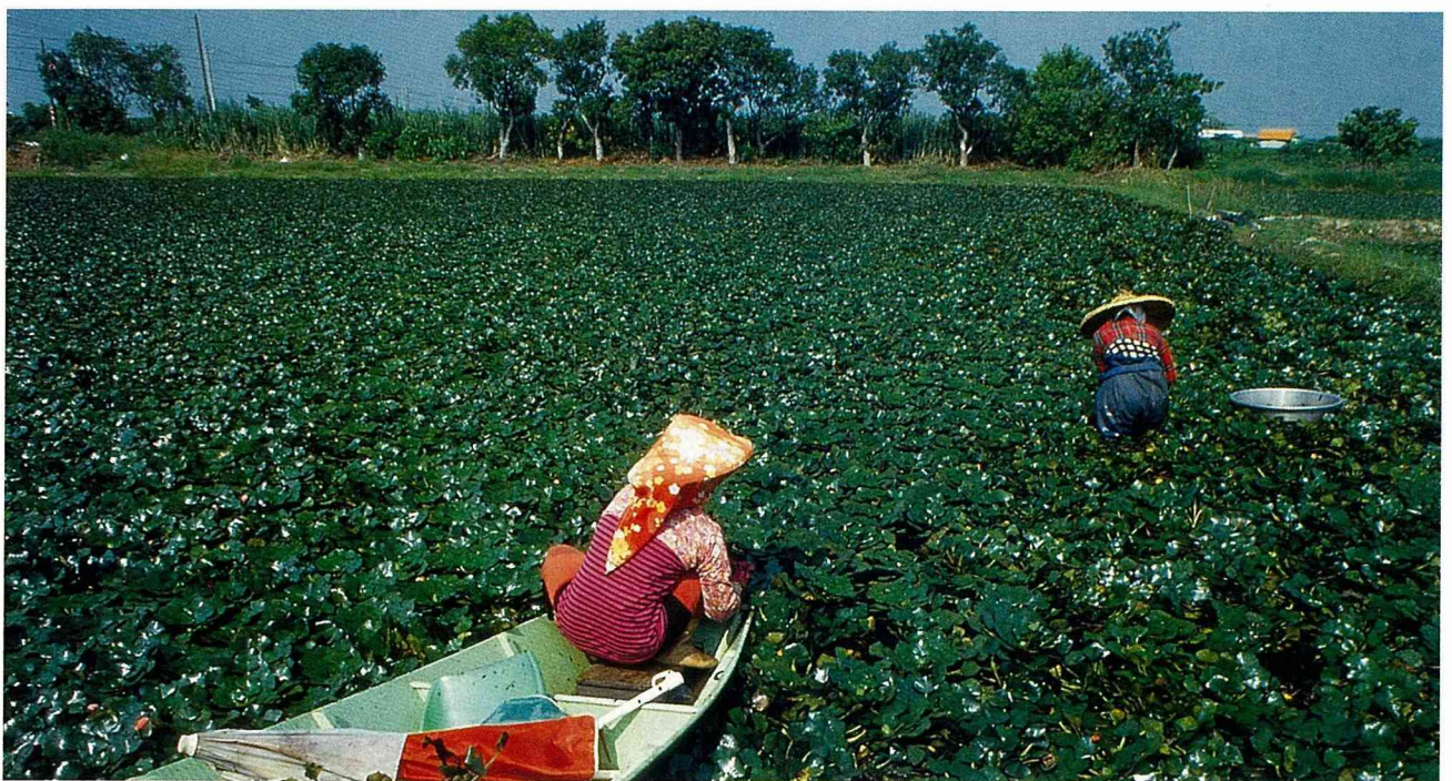
■官田的「菱香舟影」列入新南瀛勝景之一。

筆者在官田鄉只是從車上瀏覽一下，對官田鄉並不甚瞭解，以上所述未必正確，但相信是可以給官田鄉做參考的。筆者懇切期望官田鄉能以展現「總統的故鄉」所具備的特色來進行建設，如果官田鄉不保留總統童年時的景物，那遊客到官田就不能算是到了總統的故鄉，而只是到了一個尋常的台灣農村，除非官田鄉有與眾不同的特色，否則要吸引遊客就相當困難了，寬敞的道路、停車場、廟宇這些景物到處都有，以此作為充實觀光設施的主體絕對吸引不了遊客，讓遊客來到官田之後看什麼、玩什麼、吃什麼、買什麼，這些才是官田鄉從事觀光建設前，應當深思並妥善規劃的課題。