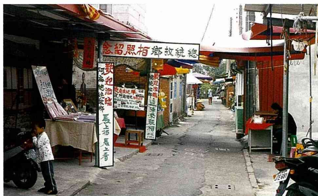
陳總統祖厝旁的巷道，變成熱鬧市街。