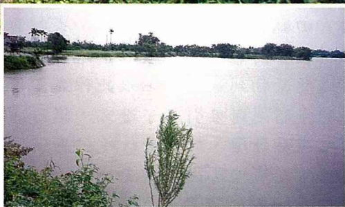
■葫蘆埤是官田鄉的水資源。

官田鄉千萬不要以「住這種房子也能出總統」為賣點，而是要以「住這種地方也能出總統」來吸引遊客，這二種訴求的差別在於前者只要保留阿扁的祖厝則可，後者除了祖厝以外，還要保留阿扁的生長環境，不可將「過去所有」的亂加剷除，「過去所無」的亂加興建，甚至還要將過去所有而現在已消失的，重新回復。