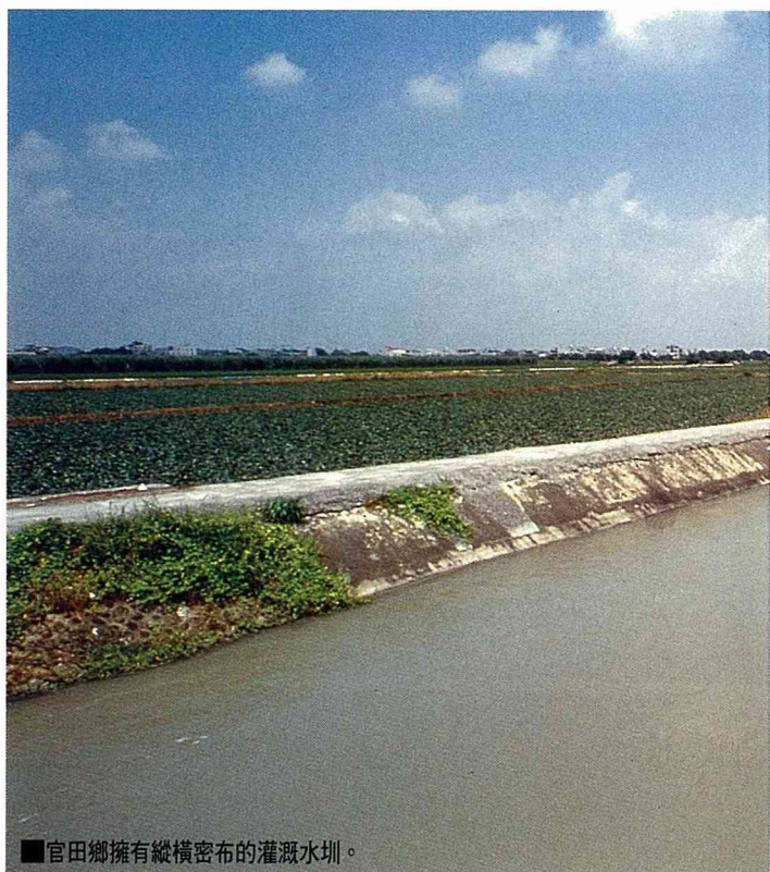
■官田鄉擁有縱橫密布的灌溉水圳。

進官田鄉，造成道路阻塞，車輛亂停，廁所不足，這些固然是問題，但其對策卻令人更憂心。