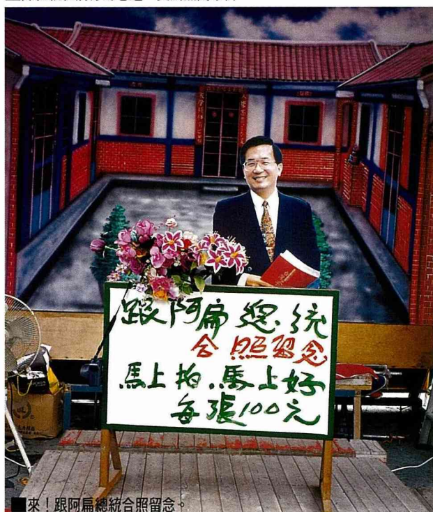
來！跟阿扁總統合照留念。

說想要蓋一棟美麗的房屋，那建築師一定無法下筆，而是要主人先決定建何種類型的房屋，要蓋西洋式的別墅？中國傳統的三合院？或是一般公寓？目標決定後，才能進一步展開設計。