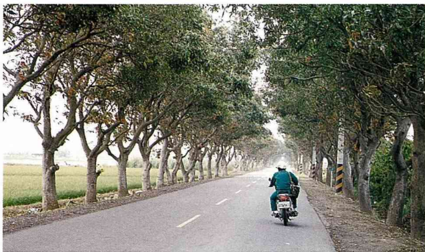
■美麗的西庄綠色隧道，

官田鄉千萬不要以「住這種房子也能出總統」為賣點，而是要以「住這種地方也能出總統」來吸引遊客，這二種訴求的差別在於前者只要保留阿扁的祖厝則可，後者除了祖厝以外，還要保留阿扁的生長環境，不可將「過去所有」的亂加剷除，「過去所無」的亂加興建，甚至還要將過去所有而現在已消失的，重新回復。