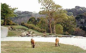
■除草義工—巴貝多黑肚綿羊。

地址：苗栗縣通霄鎮南和里 166 號 電話：037-782 999 · 782 844 傳真：037-782 399 網址： http://www.flyingcowranch.com.tw