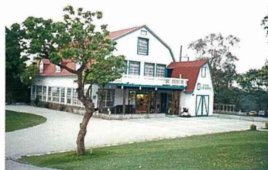
■「紅穀倉」當年是貯放乾草的倉庫。