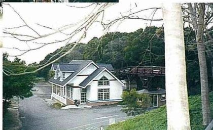
■揚溢歐洲風味的接待中心。

不但讓歐洲風味十足的老舊建築得以延續其生命，而講究人性化的整體規劃，不但以尊重自然生態保育的理念為優先考量，更以東方人文哲理的巧思為造園動線佈景，讓轉型後的飛牛牧場，奇蹟式地脫胎換骨，以更清新的風貌和豐富的內涵和國人見面。她搖身一變，成為全國最富盛名的休閒度假農場。