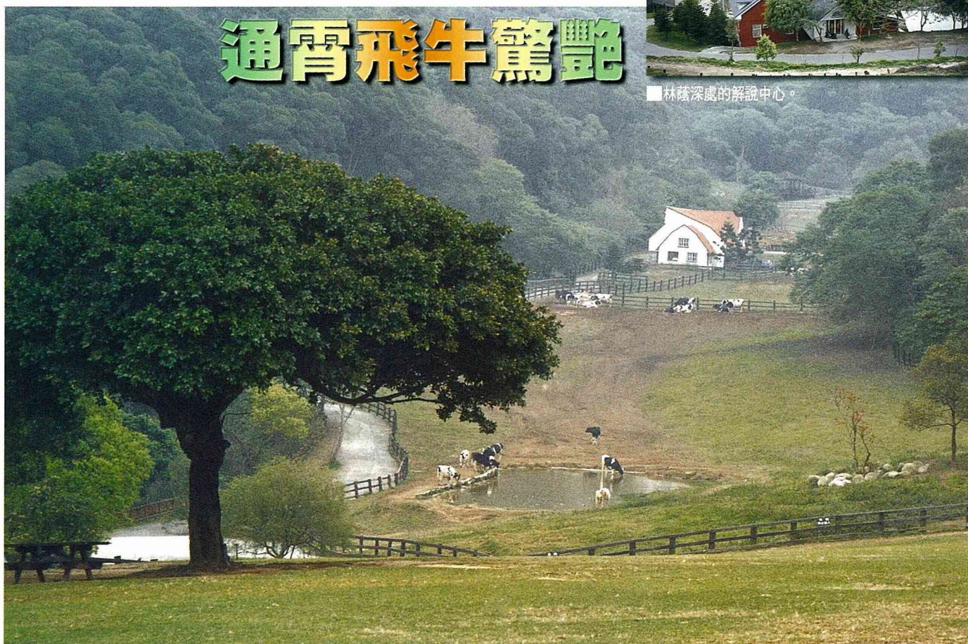
■ 草滿池塘水滿陂，山銜落日窺牛羊。