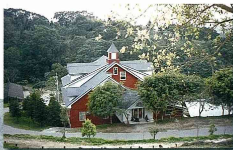
■ 林蔭深處的解說中心。