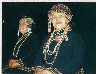
■盛裝的布農族婦女。

村、民和村，以及蜿蜒於濁水溪岸邊的丹林大道（或稱「孫海林道」），及貫穿民和村平坦的水田區，尤其到了晚上，該路段路燈通明，構成山村神秘的夜景。