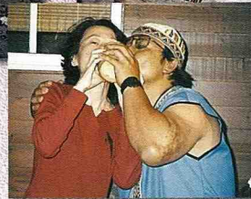
■布農族人與遊客共飲小米酒。

的各部落，數十年後已成廢墟。老部落遺蹟對於布農族人，有尋根認祖的精神意義，在人類學研究領域，更視為珍貴素材。