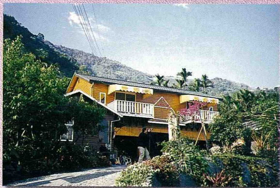
■雙龍客棧民宿提供食宿。