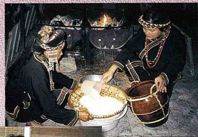
■布農族婦女自己釀製小米酒。