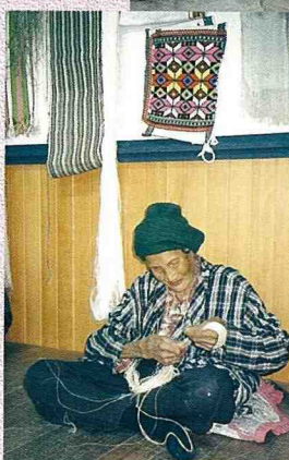
■拜訪雙龍部落國寶級(90歲)的編織婦女。