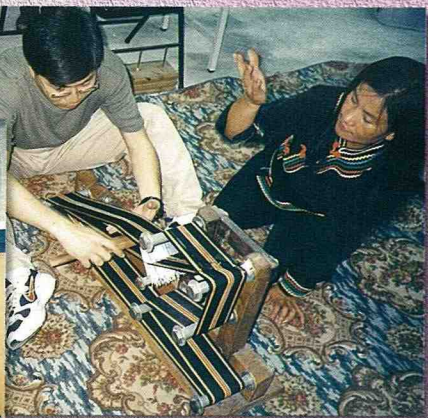
■遊客親手體驗手工織布。

南、民和，及西鄰的人和村，北望高山，無論晴雨寒暑，均有一種出世脫俗之美，溪風拂身，又自有一種飄然忘我的感受。其間的大香楓樹區，適宜作為景觀台及露營區。從雙龍國小下坡西行的小徑，原為古步道，可連結至雙龍橋及景觀台預定地，沿步道而行，可一覽梯田的變化。