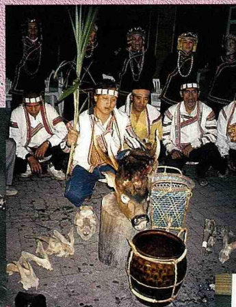
■布農族狩獵祭槍歌表演。