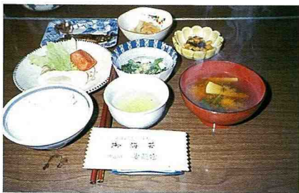
■妻籠民宿的早餐，精緻而有當地特色。