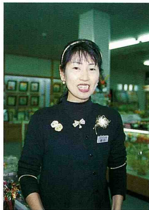
■展售場裏商品多樣化，美麗姑娘的頭飾及服飾是非常有特色的工藝品。