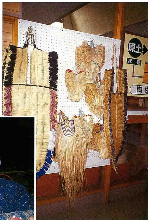
■稻草傳統編織的細工展品。

鐵，男人們幾乎都出外賺錢去了。在沒有年輕人的村落裏，就連晒幼兒尿布的景象都無法見著。過去光榮一時的宿場之店屋群，木結構建築之瑣腳地樑也已腐爛，屋檐也已傾斜，失去了生氣，簡直就成了鬼城的樣態，甚至讓人開始擔憂村落會完全死亡。