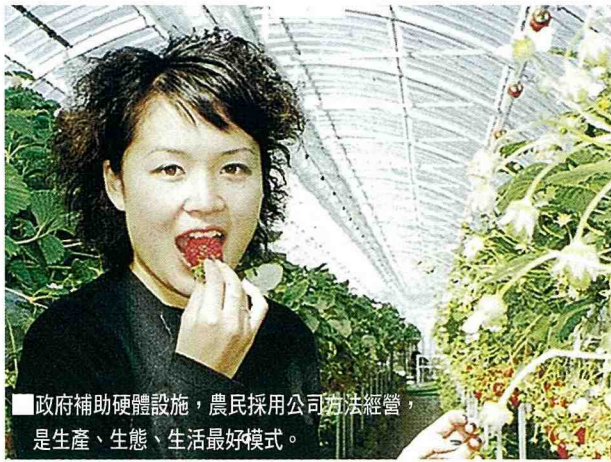
■政府補助硬體設施，農民採用公司方法經營，是生產、生態、生活最好模式。

是日本最大級 8,000m 2 (2,400坪) 搭建的網室設施，上下二層立體栽培，上下品系不同，下層是可耐陰、較小果實的品系，但較甜；岩棉的栽培管理（根旺、清潔、營養液由電腦控制），1-6月皆可收穫，比一般栽培多 1.5 倍產量（每半斤售價日幣 500 元）。政府補助設施，以公司方式來經營，政府技術指導，農園配合休閒設施，開放採果觀光，是結合生產、生態、生活三生產業的最好模式。