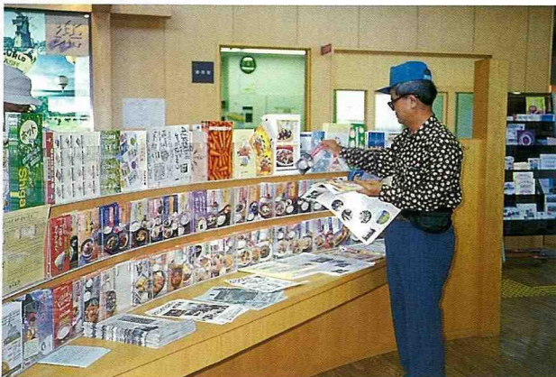
■近 100 種米食譜的展示架。