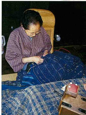
■善用老人與婦女之才藝傳承。