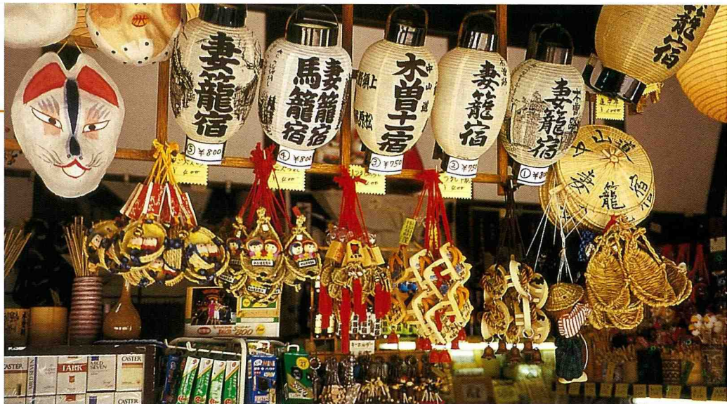
■妻籠老街店屋群(農特產及工藝品)。