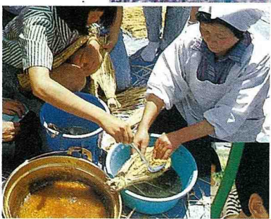
■利用寒暑假，辦理青少年農村體驗活動。