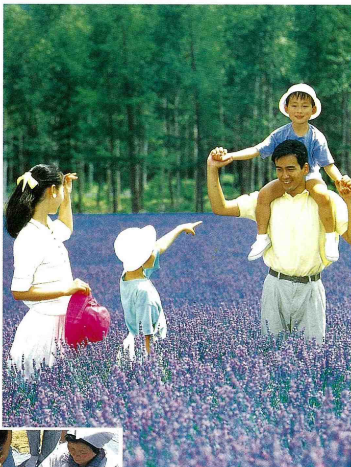
■親子同遊美麗的自然景觀。

農村旅遊應先制定完備之法規：食品衛生與安全旅遊等管理規範，以來維護農民權益與遊客之安全。以經濟知識為策略，運用五大資源，促進農業之生產、生活、生態的三生。