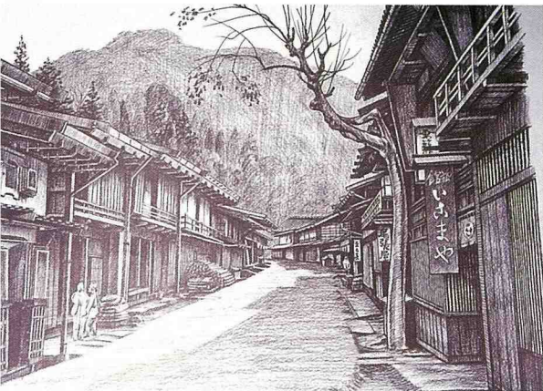
■妻籠宿，當年沒有生氣的村落景象。