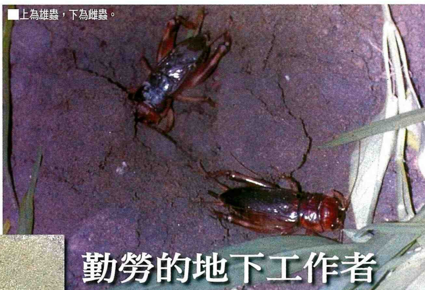
■上為雄蟲，下為雌蟲。