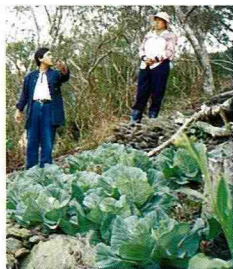
■ 休閒農場的有機甘藍。

通往大漢山農場的唯道路乃大漢林道，路面尚未鋪設完成泊油路，僅由兩條水泥道路構成通道，寬度僅可容納一台小客車的通行，雨天泥濘難行，於前往農場途中會經過一