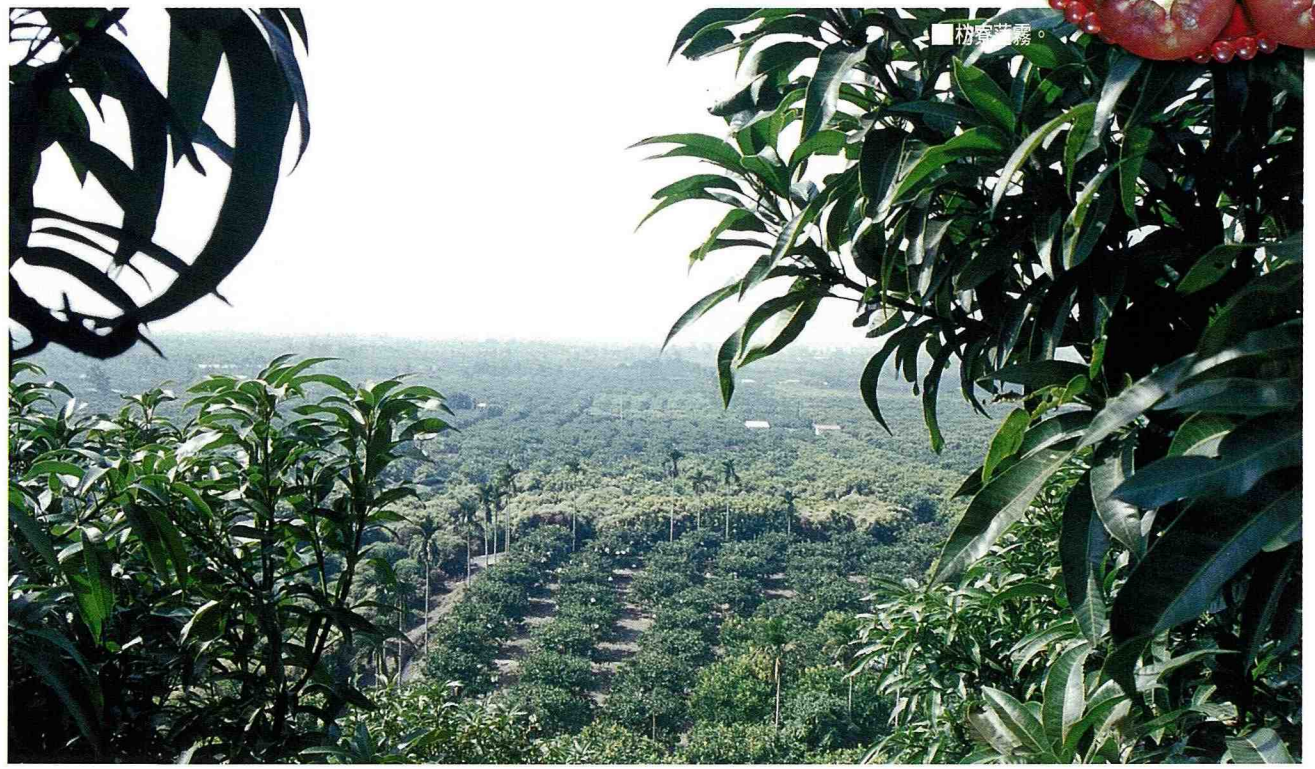
■ 在果園至高點遠眺。