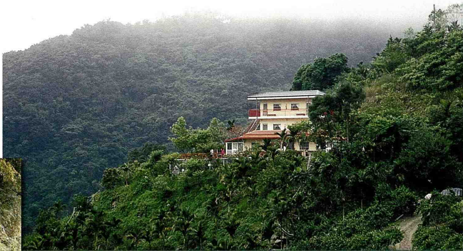
■ 位在台東縣卑南鄉利嘉林道山區的太平生態農場。