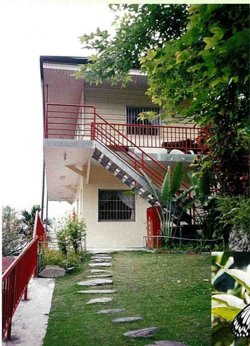
■農場提供住宿套房。