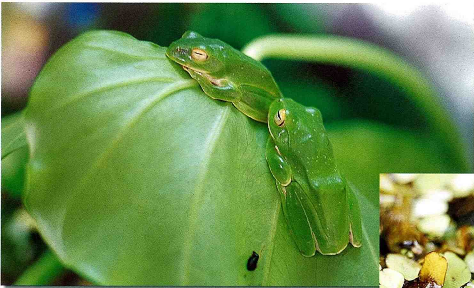
■有保護色的莫氏樹蛙。

賞蛙和探索生態的活動，是一項知性的休閒。要在微濕的綠叢中，探尋可愛的身影、聆聽牠們精彩的生命樂章、觀賞新奇的蛙類世界，必須持有一雙銳利的眼睛和聽覺敏捷的耳朵。而出發前的安全防護及準備，是成為賞蛙探險家的首要條件。