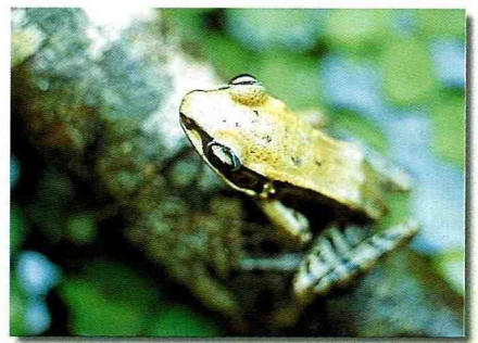
■夏日是台灣蛙類最活躍的季節。

手電筒、雨鞋、帽子和棍子是基本配備，因為牠們在晚上活動，大多棲息在水溝、樹林或山澗溪流等陰暗潮濕的地方，在找牠們時，頭可能會碰到蜘蛛等小動物，腳可能會踩在水裡或爛泥巴裡。棍子除了可以撥出躲在落葉堆中青蛙外，還可以打草驚蛇。