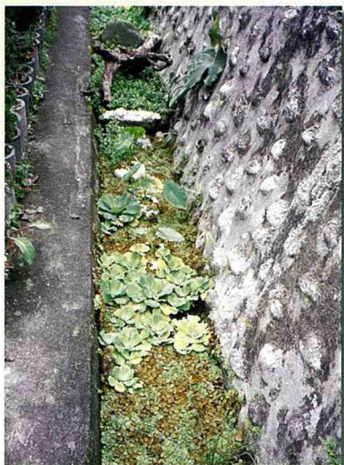
■農場營造的親水環境。

好，太冷或太熱時，都不容易找到青蛙。第二看環境，蛙類通常出現在潮濕、地上有落葉、滲水或積水、長有苔蘚等耐濕植物、遮蔽良好，陽光不會直射的環境。第三聽音定位，這是最重要的方法，但要有耐心，動作也要輕，由於蛙類很容易因受到干擾，而停止鳴叫。第四留意小細節，有時候會覺得青蛙就在腳前鳴叫，卻找不到，此時要注意是不是躲在葉片的背面、樹根、洞穴、落葉、小石塊底下鳴叫？必要時可以稍微翻動，但容易驚擾到牠們。