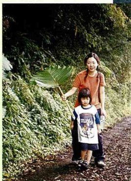
■ 姑婆芋的大葉片，蔽護著蛙類的棲息環境。

太平生態農場備有各式雅房，夜晚三五好友就著夜景，品茗聊天納涼，談天說地，觀星望斗，好不愜意。夜間趨光前來的昆蟲，是小朋友的最愛，不論是獨角仙、鍬形蟲、長尾水青蛾，都是最好的自然生態活教材。若是熄了燈光，躺在草地上，看看滿天星斗，也是不錯的活動，大熊星座、獵戶星座、織女星星座，還有一閃一閃亮晶晶的火金姑，飛來飛去，數著數著，蛙鳴「呱！呱！呱！」，伴您入夢鄉。