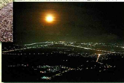
■ 月光下的台東市夜景。

農場裡也栽植各式花果，依四時花開結果，提供遊客賞花採果。元月至2月間，山櫻花、李花盛開，宛如少女般紅的臉頰映著粉白的肌膚，煞是好看；3-4月，桃花、杏花爭妍鬥艷紅似火；4月梅子成熟，農場開放採梅，教導遊客釀梅、製梅酒；4-5月，李子成熟，4月宜蘭李、桃成熟，搶頭先品嚐；5月胭脂李紅透，肥美多汁，甜份高，是太平生態農場的特產；8-9月，文旦、葡萄柚伴手過中秋，柳丁垂滿枝頭任您摘。