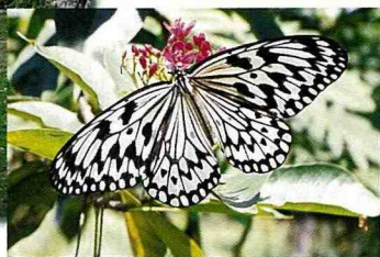
■農場也進行蝴蝶復育。