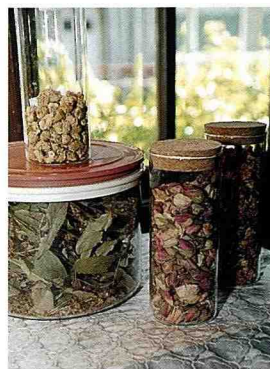
花茶原料，強調野生或有機栽培。

所謂的好轉反應，是身體對新的刺激的反應，以恢復正常狀態、改善體質的表現。如弛緩反應，即向來處於有病狀態的內臟器官，開始恢復它的原本機能時，其他器官為配合而暫時失去平衡的狀態，症狀有睏倦、倦怠感；排泄反應，是身體解毒功能的表現，症狀如出疹、長腫皰、皮膚變化等，其他如過敏反應、康復反應等，皆因個人遺傳因子與生活環境的條件不同而有差異。