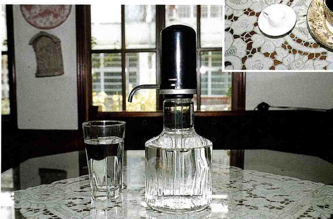
■ 許多客人一進門，就先要一瓶π Water。