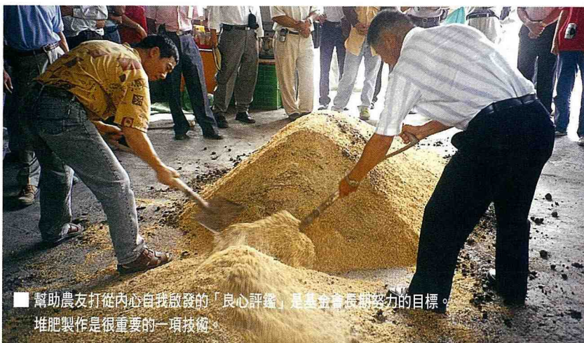
幫助農友打從內心自我啟發的「良心評鑑」是基金會長期努力的目標。堆肥製作是很重要的一項技術。

費者建立誠信互助的基礎，扮演非常重要的角色，基金會的認證精神，初期希望以嚴謹的作業制度，公正、客觀的為張貼「慈心有機證明標章」的每一把蔬菜把關，建立公信力量，目前我們正積極培訓更多人力，希望藉由這一群有心、有理念的評鑑義工投入，在落實驗證制度作業的同時，一起將「尊重生命、關懷自然」的慈心理念帶給農友，善心善念的薰習，以道德良知為主，輔以評鑑驗證制度，幫助農友打從內心自我啟發的