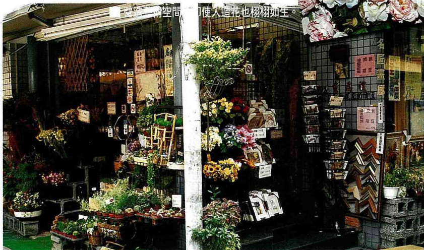
■ 門前花團錦簇，連電線桿也美美的。

或花藝作品時，她會儘可能前往現場觀察，有時是住家，有時是辦公室，不同的空間，會有不同的感覺、不同的體會，同時了解主人的喜好，她再「量身打造」，往往簡單的室內裝潢，卻因為一幅畫、一盆花而顯得生氣盎然，甚至煥發新的光采。