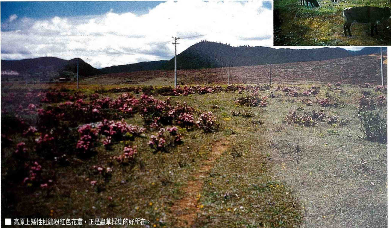
■ 高原上矮性杜鵑粉紅色花叢，正是蟲草採集的好所在。

東南亞各國，由於生態環境遭破壞，現在年產量大幅遞減，為了挽救此一珍貴藥材資源，大陸當局聯合許多單位進行研究及復育工作，以