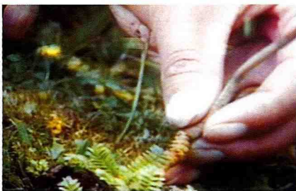
■ 手拿剛挖到的蟲草，快樂無比！

據當地人說其祖先多為牧民，因長期觀察到牛羊吃了蟲草而肥壯因此知其藥效，應是合理的傳說，而德欽的藏人也常挖食蝙蝠蛾幼蟲，聽說也很補呢！