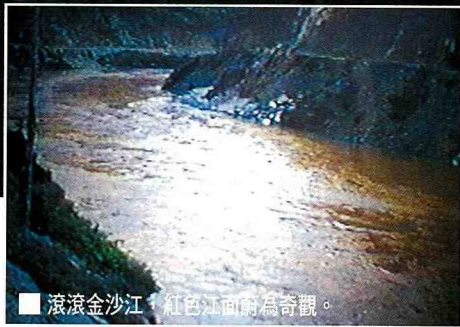
■ 滾滾金沙江，紅色江面蔚為奇觀。