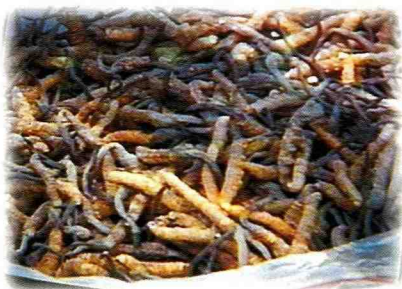
■ 市集販售一大簍蟲草，正是熱門搶手貨。

德 欽，這名不見經傳的地方，大家可能極為陌生，其實幾年前中視「大陸尋奇」節目中曾經報導過，只是被人淡忘了。它是大陸冬蟲夏草主要產地之一，有一次機緣與一位買賣中藥材的朋友一同走訪該地，發現它是一處既隱密又神秘的世外桃源，令人印象深刻，就讓作者慢慢地揭開它神秘的面紗吧！