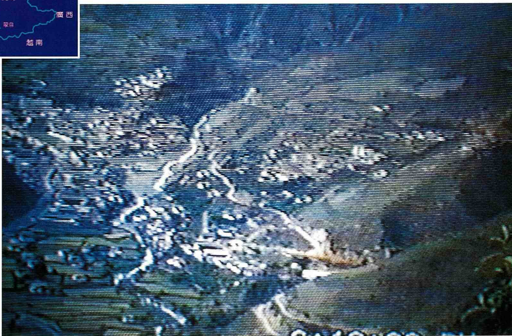
■ 德欽小山城座落在山谷內，依山傍水。

德欽，這雲霧迷漫風景秀麗的小山城，是雲南德欽自治縣之縣治所在，在雲南省西北部海拔3500公尺的高原谷地上，其周圍有怒山、雪山、玉龍山等超過4千公尺以上的群山圍繞著，這些山脈是雲南主要河川金沙江、瀾滄江及怒江的發源地，德欽縣城旁臨金沙江，金沙滾滾之紅色江面蔚為奇