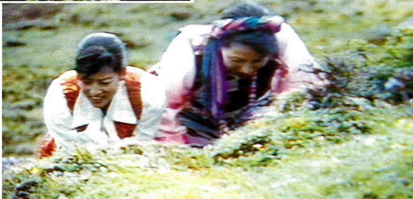
■ 兩藏族婦女蹲在地上，聚精會神地在尋找突出地面的蟲草。