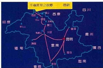
■ 冬蟲夏草之故鄉—雲南德欽地理位置圖。

德 欽，這名不見經傳的地方，大家可能極為陌生，其實幾年前中視「大陸尋奇」節目中曾經報導過，只是被人淡忘了。它是大陸冬蟲夏草主要產地之一，有一次機緣與一位買賣中藥材的朋友一同走訪該地，發現它是一處既隱密又神秘的世外桃源，令人印象深刻，就讓作者慢慢地揭開它神秘的面紗吧！