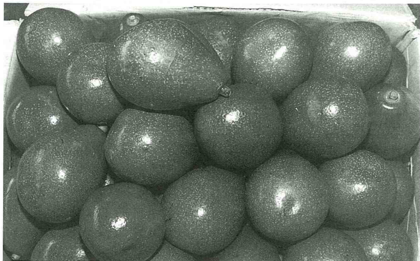
■ 酪梨營養豐富，有「森林裡的奶油」美譽。