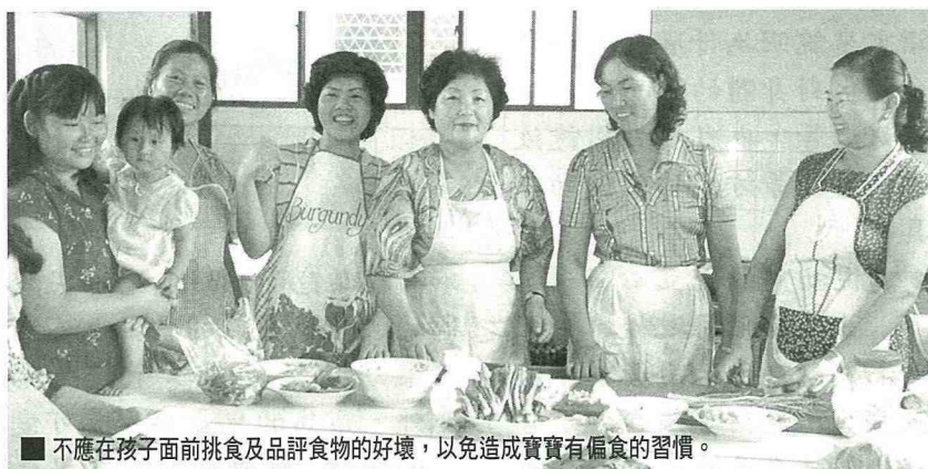
■不應在孩子面前挑食及品評食物的好壞，以免造成寶寶有偏食的習慣。

寶寶討厭某種食物的原因，有時不在於它的味道，而是烹調的方式。例如在質地方面，幼兒長牙之後喜歡有咬嚼感的食物，也許會拒吃蘋果泥，不防改成蘋果片。色彩方面，幼兒對色彩的敏感度十分強烈，可善用顏色搭配，來促進寶寶的食慾，例如孩子喜歡色彩鮮豔的食物，若烹調成灰灰黑黑的，較難引起寶寶的食慾。在溫度方面，太冷或太熱的食物也會使幼童感覺害怕。在調味方面，食物的口味不宜太濃，也應儘量避免刺激性食品。食物的形狀也必須經常加以變化，可提高幼兒進食的興趣。