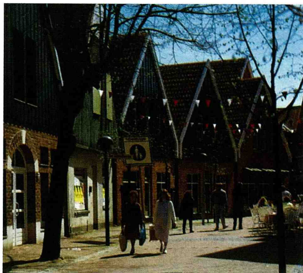
■ 沿街而立的鄉村住宅。(圖4)

感覺來經歷的。以上所述皆可透過語言表達，如果說到幸福與悲傷，我們就會無言以對，但是我們又能感受到更高層次的精神領域。