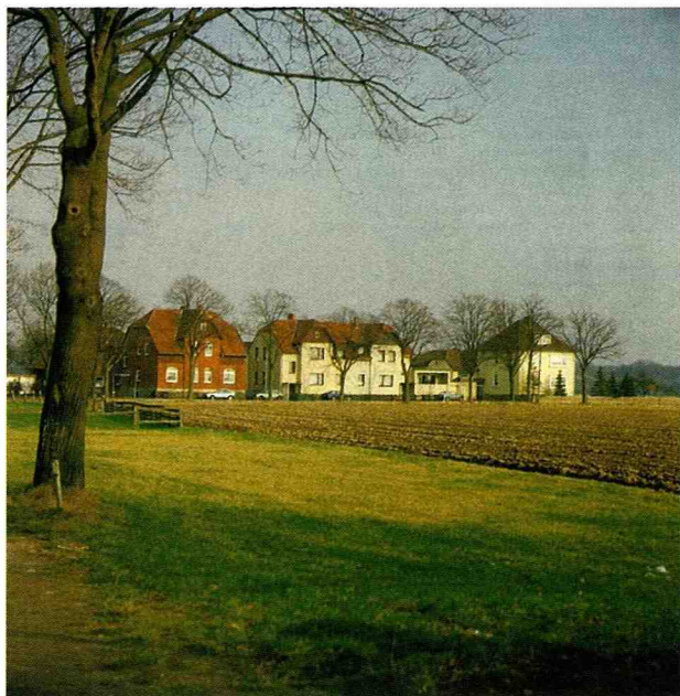
■ 在景觀中興建建築物，可以取得自然景致。

很多人開始覺悟，我們的時代可能性不能無限制地被利用，因為，如此一來我們將失去人類尺度，亦即生活所需秩序。我們將對立足點提出質疑，亦即通過自我省思，對周圍環境作出反應。許多城市生活者，仍對農村和景觀擁有自我之可能性，抱持著希望，並認為農村空間價值之本質能被妥善保存下來，將來才有機會一部份一部份慢慢地被釋出。而農村中的每一種變化，在這種認知之下，應保有無過多人為因素介入之特質。很多農村居民，渴望分享文明的成果，透過媒體及廣告對較好生活條件之承諾，而擁有更多之居住空間。但最後人們終將發現，放棄舊事物及生活方式，根據虛無之方向來建設農村，農村將因此出現新的建築形式、區域、材料以及新的人。