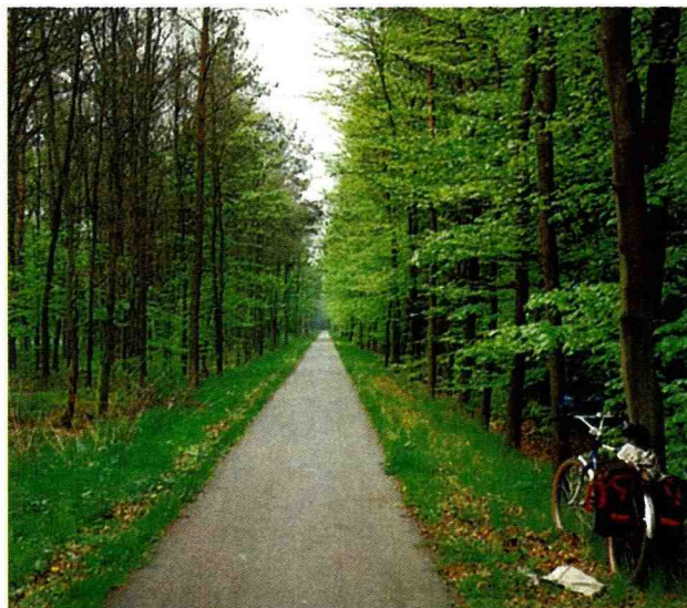
■ 作者騎腳踏車，用靈魂去尋訪農村。

在景觀中興建建築物可以取得自然景致。每一鎊土，重約5.6公斤，在以前人們必須鏟很多土才能創造一個建築基地。建築材料必須符合手的尺寸，這樣人們才能很方便地使用。以前的建築材料都是就近取得，因為鐵路水路交通不發達，長程運輸是不可能的。因此，建築的意念與取材，都與所在地息息相關；漸漸地，居住地在農村空間中逐漸擴大形成小城市；而這些居住地的間距，則與地理、環境以及一天當中來回行程長短有關。