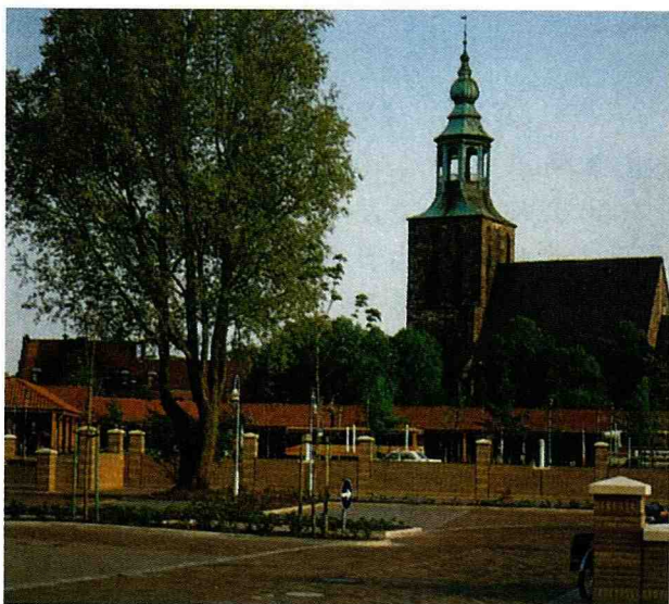
■ 北德農村中，一鄉鎮，一教堂。(圖3)

對農村而言，什麼是好的、對的、醜的？今天，呈現出多樣化的觀點，如同本世紀經歷過自由變遷的社會一般。也許，你自己可透過幾個具體的例子，來驗證自己的觀點。