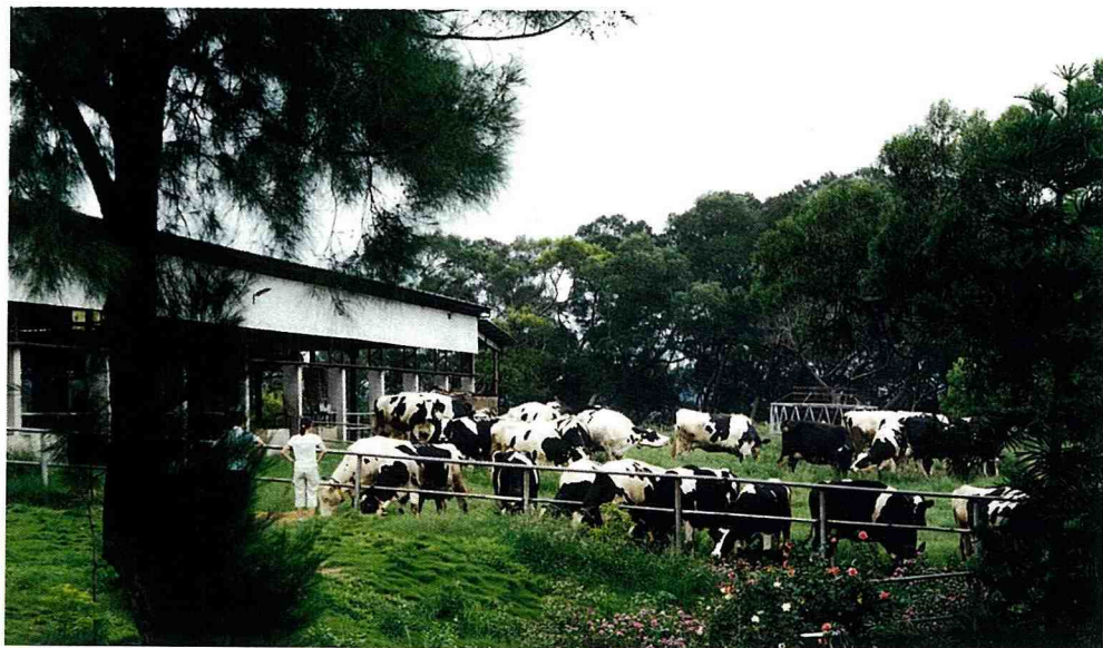
■ 進士牧場，綠草如茵。

以前我住在新竹的時候，偶而在傍晚時分驅車前往牧場拜訪老友。每當獨自一人在稜線上的道路中驅車漫遊，或者迎著夕陽徜徉其間，清風徐來神清氣爽，恣意看山讀山，隨興看海寫海，渾然忘我；直到目送落日西下，斜陽映照霞光滿天，猶不知夜幕悄悄降臨大地。當我心馳神遊之