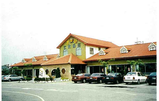
■ 老鍋休閒農莊供應各式美味的新竹小吃。