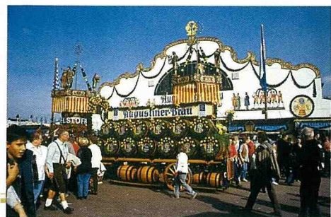
啤酒節巨型帳篷入口。

自從1516年巴伐利亞公國的威廉四世大公頒佈「德國純啤酒令」以來，德國啤酒業一直遵守這項規定，為德國啤酒的品質做了最有力的保證。「德國純啤酒令」規定製造啤酒只能使用大麥芽、啤酒花和水這三種原料（當時酵母菌還未被發現），其他附屬原料絕對禁止使用。