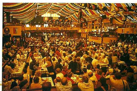
■ 巨型帳篷內酒酣耳熱的飲酒場面。