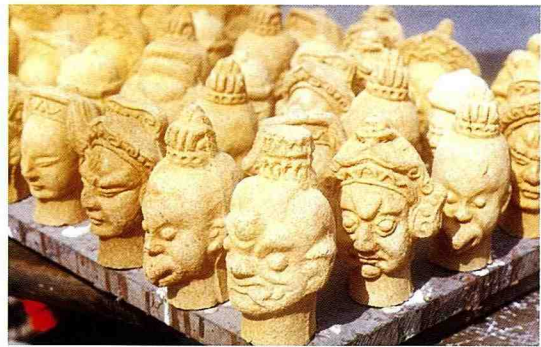
■ 土黏香成型後呈原色，需在陽光下曬乾。