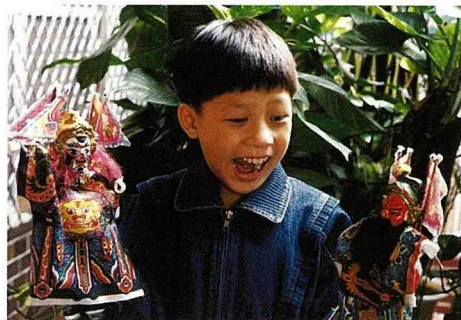
■ 土黏香是二、三十年前小朋友的玩具之一。

一口濃濃的鹿港腔調，渾身上下流露著一股鹿港人質樸與憨厚的施欸老師傅，他在鹿港鎮製作土黏香戲偶