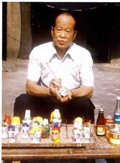
■ 施欸老師傅是土黏香戲偶的佼佼者。