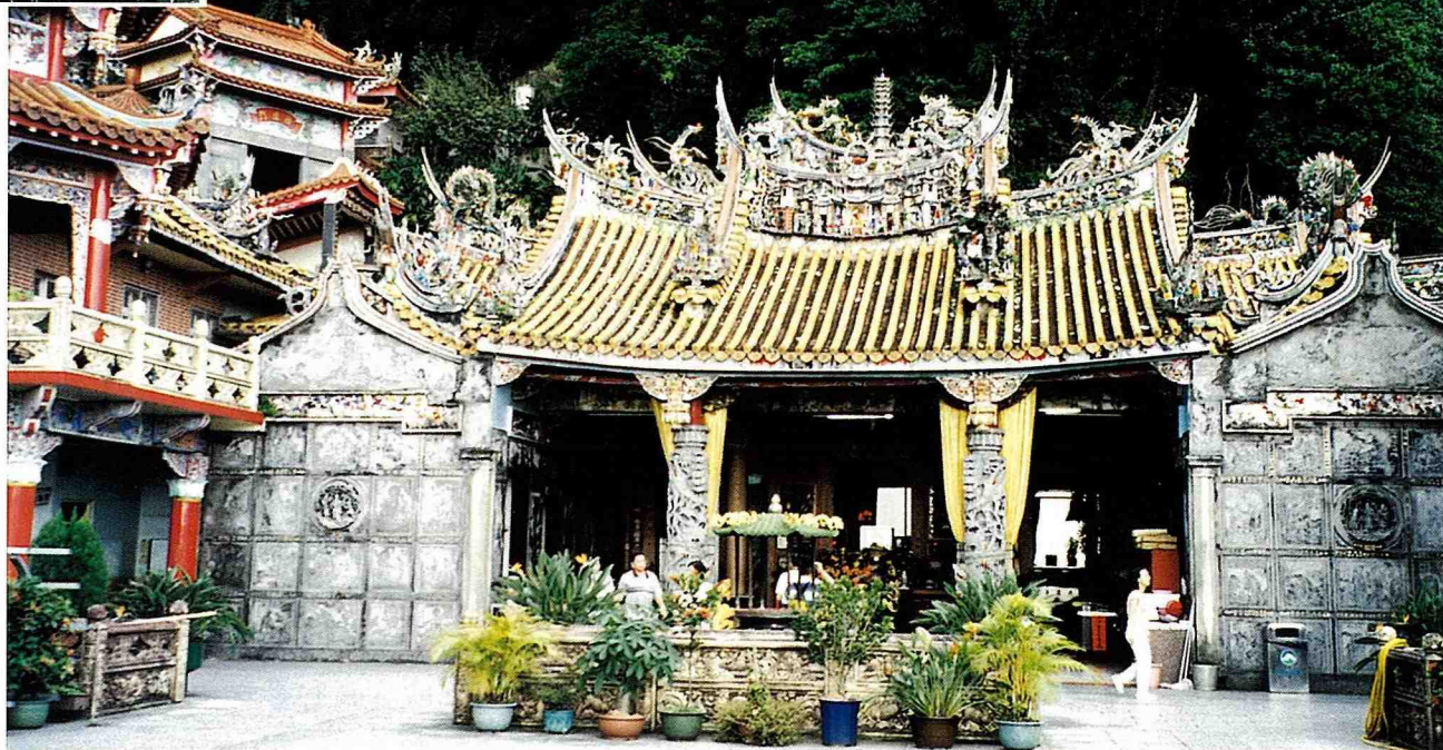
■ 毓秀鍾靈獅頭山，為全台著名的儒釋道三教聖地。