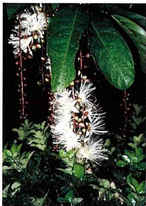
■ 冷傲的「穗花棋盤腳」，夜間展現神秘花容。

清晨4點不到，悅耳的鳥叫聲催著我不要再懶床，蟲鳴鳥叫聲此起彼落，推開房門，信步走出戶外，飽含氤多精的清新空氣，令人心神振奮，此時此刻，不必聆聽晨鐘暮鼓，人煙盡滌，塵慮全消，有福氣的人才能享受造物主恩賜給我們這份無價的珍寶！