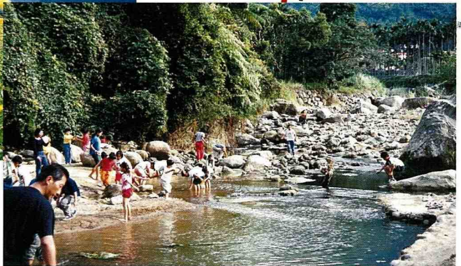
■ 清澈的抽藤坑溪是小孩子的快樂天堂。