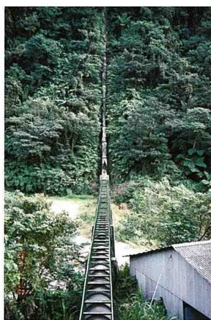
■ 歷史悠久的白冷圳是值得探訪的文化古蹟。

除了田園美景，這裡還擁有遠東地區規模最大的虹吸管—「白冷圳」水利工程，利用台階地形的高度落差，不必使用動力設備，橫跨溪谷而完成輸水大任。新社鄉70年來的用水全靠這條虹吸管，在歷史上極具意