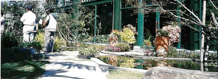
■ 充滿自然風情的千樺咖啡屋。