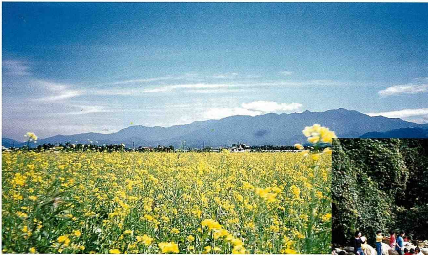
■ 二苗園的大片油菜花田與藍天相映，最叫人心曠神怡。