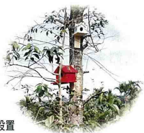
■ 設置鳥屋，歡迎小鳥來作客。