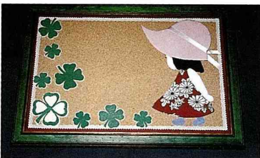
■ 充滿遐想的幸運草公佈欄。