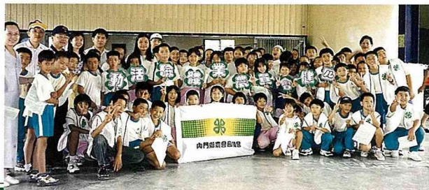
■ 農業體驗活動—參觀內門有名的芭樂園。

校的白眼，因為不知四健在做什麼？而如今今年度的計劃，尚未送出，一些學校已跑來預約，這是讓最她感到欣慰的。由於內門地廣，人們住得疏散偏遠，所以辦活動的內容，就必須考慮四健會員的交通與方便性，因此儘量不在晚上活動，而活動多選擇在學校，作業組也在白天完成。