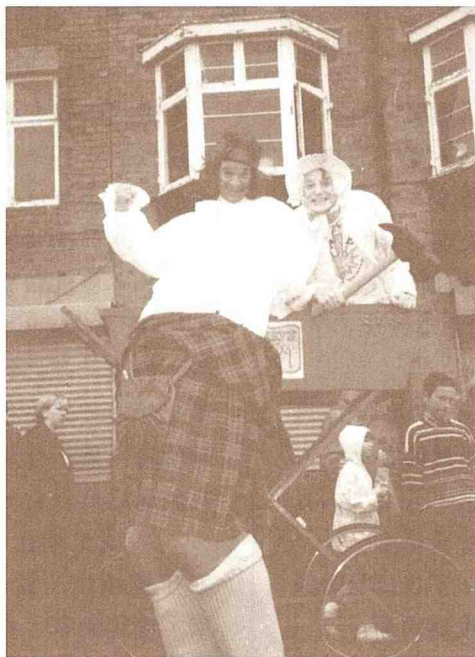
邁進新世紀的西方婦女，呈現出回歸純女性的風潮。

英國少女還是最早熟的一群，88%的婦女坦承，她們於20歲以前就早已初嘗“雲雨情”。被訪的中學女生中有40%承認經歷過一夜情的浪漫，四分之一少女表示，有時會在毫無避孕的情況下與同伴發生性行為。其中64%的懷孕