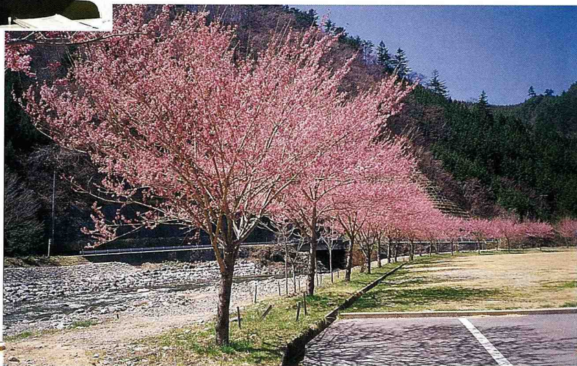
■ 清見村優美的河川景觀。

經過以上努力，清見村人口已不再減少，而且據說每年有3~4億圓的所得回歸到山村來，可見已收到相當的經濟成效。