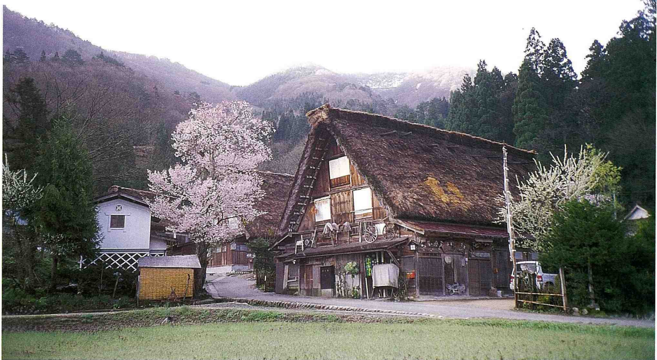
■ 遺世獨立的白川鄉合掌屋。

白川鄉自從1971年開始推動文化資產保存運動，配合雄偉的自然資源，以「觀光立村」為目標展開種種活動，現在前往當地觀光的人口，一年已超過140萬人次，我們也在當地的茅草屋民宿住了一晚，感覺非常新鮮，不但村內景觀特殊，而且村中看不到一點垃圾，水流清澈，絕對是值得一遊的好地方。