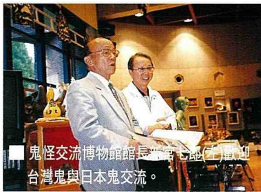
■ 鬼怪交流博物館館長(左)與台灣鬼怪交流會會長(右)在博物館內交流。