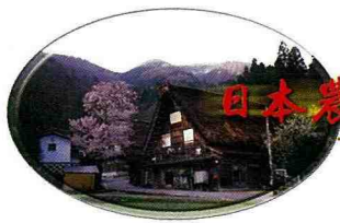
■全體團員在白川鄉的櫻花樹下合影留念。