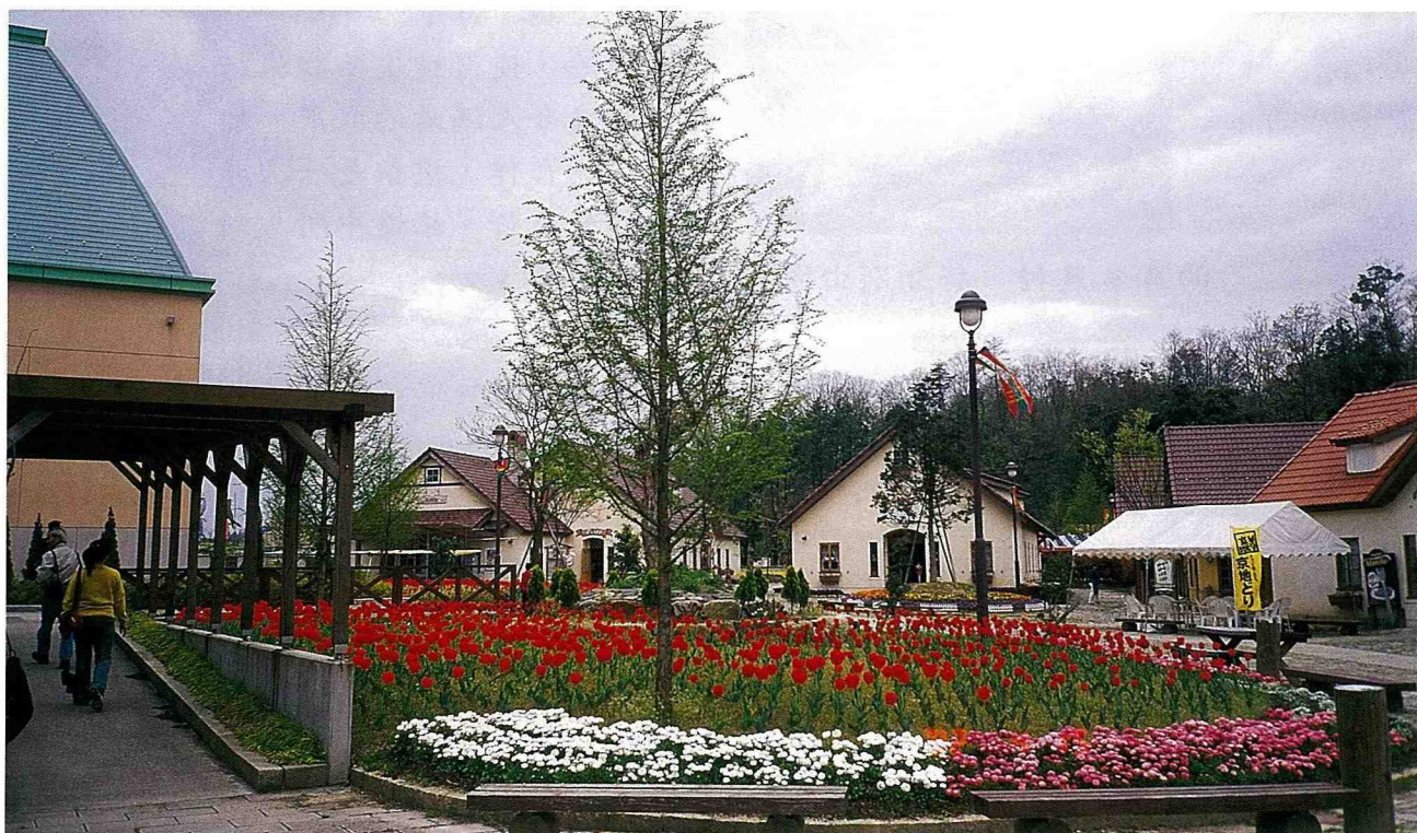
■ 景致優雅的丹後農業公園。