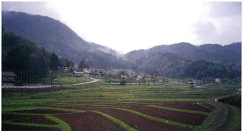
■ 入選為日本百大梯田之一的大江町梯田。

大江町為保持毛原地區的梯田風貌，乃從平成9年至11年，投入7,500萬圓的經費從事景觀維護，開闢散步道路，興建水車小屋、涼亭等，並美化周邊環境，讓都市居民來到當地，不僅可以看到獨特的梯田風貌，而且會讓他們喜歡這個地方，常來當地體驗梯田農業，甚至搬到當地居住。他們的建設目標有以下五項：