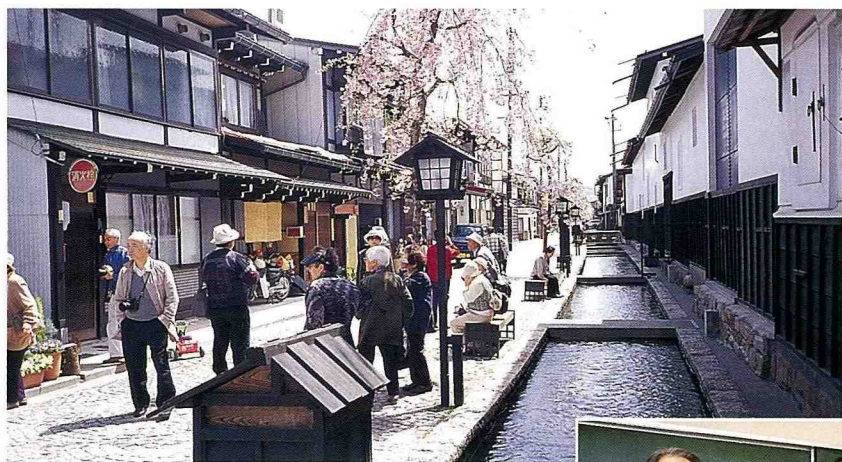
■ 古川町是日本社區營造的經典之作。