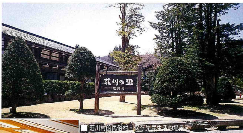
■ 莊川村的民俗村，保存先民生活的場景。