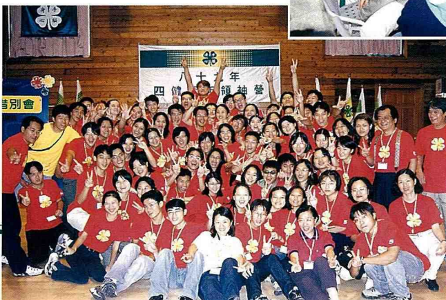
■ 第六屆四健領袖營。