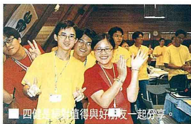
■ 四健作業組值得與好朋友一起分享。

這次被推選出來擔任四健會總會的會長，不是受之無懼，而是「我知道四健大團隊的所有人都會“挺”我」，小學女生的清楚與自信令人佩服。