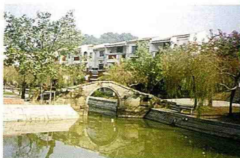
■ 白河蓮花。 ■ 台南藝術學院。

珊瑚潭劍橋大飯店為服務旅客，可代為安排附近景點二至三日遊。包括台南科學園區及台南藝術學院欣賞壯觀、藝術的建築園區。另外，附近的七股鹽場、西庄、蓮花世界、隆田酒廠、關子嶺溫泉等，都是值得前往一遊的景點。