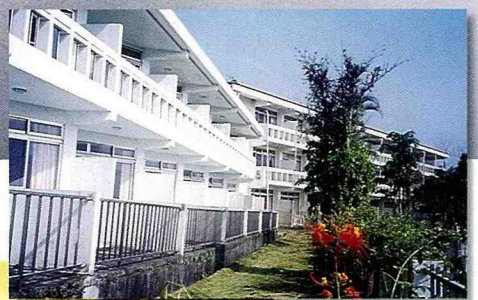
■ 珊瑚潭劍潭大飯店的外觀。

珊瑚潭風景區擁有大自然風情，還有植物光合作用製造的新鮮空氣，以及燦爛的陽光等；珊瑚潭劍潭大飯店提供完善的餐飲與住宿設備外，還有多樣化的休閒娛樂設施，以及可容納200人、120人、60人等大小規模的會議廳(室)，附有投影機、單槍投影機、幻燈機等，並可全程錄音，設備齊全，是典雅、尊貴、格調、休閒、渡假、會議的最佳選擇。