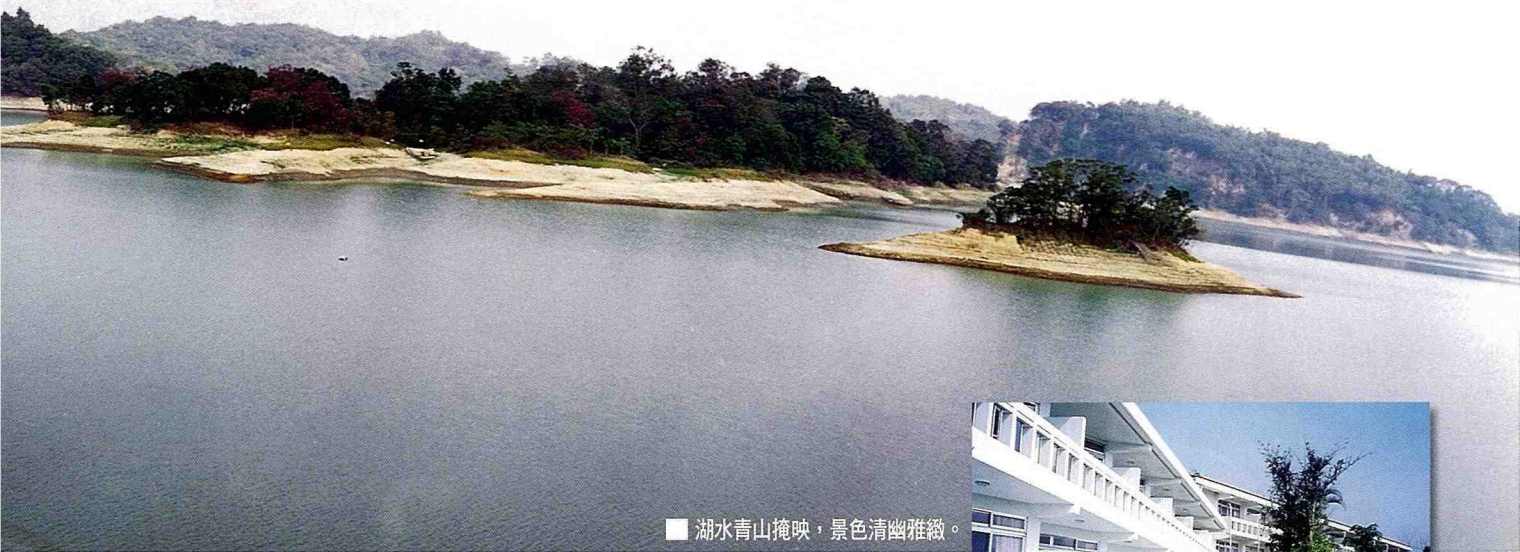
■ 湖水青山掩映，景色清幽雅緻。

珊瑚潭劍橋大飯店位於珊瑚潭風景區湖畔旁，窗前可俯瞰水庫全景，歐式浪漫的建築外觀，背倚湖潭，珊瑚潭沿岸林木蒼翠，碧草如茵，湖光山色相映成趣。飯店周圍有多處景點，如造型宏偉之大壩、溢洪道、送水站、三角埤公園、野外活動區、親水公園、鳥園、天壇等，放眼所及，處處皆框景。氣氛佳的湖濱咖啡廳，不但有優美的視野，還擁有露天咖啡座，讓您在渡假休閒之餘，能享受香醇的咖啡，欣賞烏山頭水庫之美。