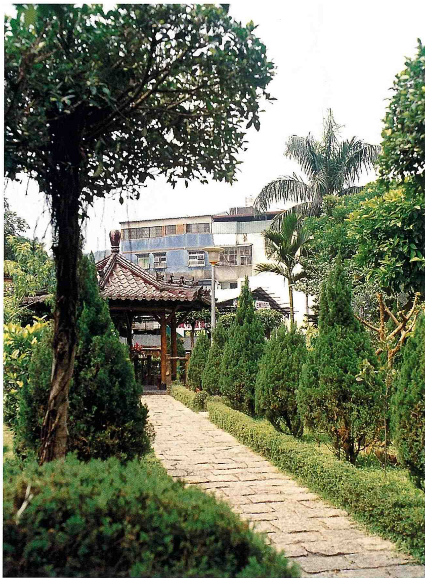
■ 公園造景，處處用心。